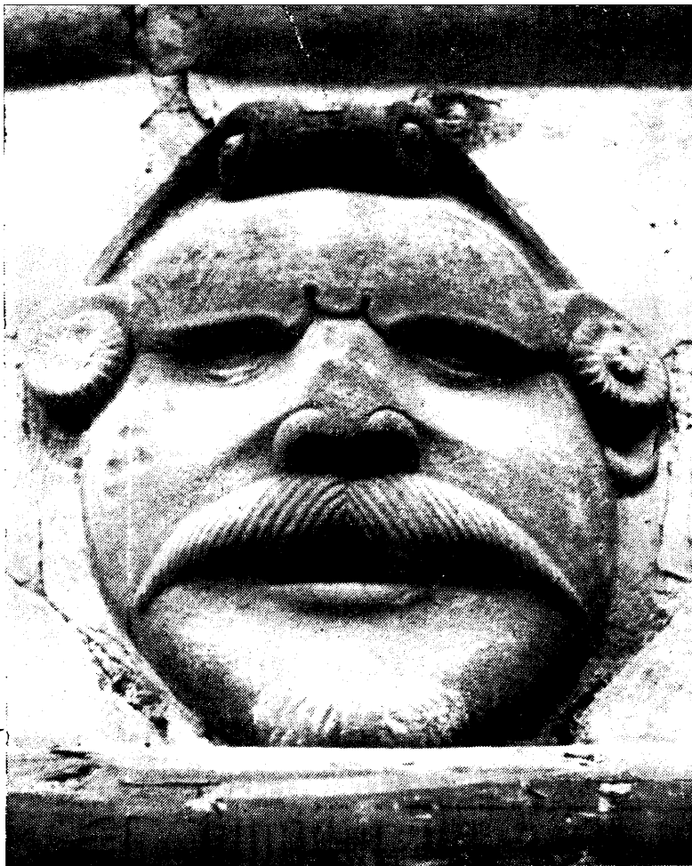
Ryc. 95 i 96. Pieskowa Skała. Odkryte maszkarony w podwórzu arkadowym zamku.

wego dwukolorowymi freskami liniowymi w stylu epoki. — Wolor plastyczny ciężkiej architektury krużganków nadawał jednak dominujące piętno tej części zamku.