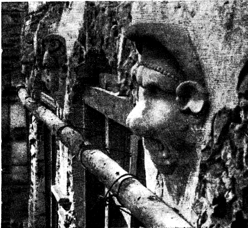
Ryc. 97. Pieskowa Skała. Fragment ściany zamku z odkrytymi maszkaronami (fot. S. Kolowca).

na II piętrze 1) . Liczne węzły, które łączyły ród Szafranców z dworem królewskim wskazywałyby na to, że dziedziniec wawelski był natchnieniem dla Stanisława Szafranca, kiedy zlecił zbudowanie krużganków arkadowych w Pieskowej Skale zapewne jednemu z mistrzów włoskich, którzy w owym czasie przebywali w Krakowie 2) .