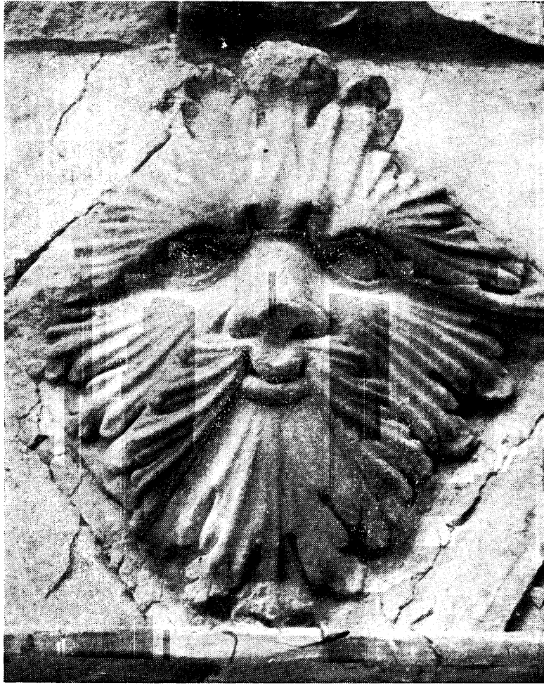
(fot. S. Kolowca).

rzeźbionych w kamieniu pińczowskim maskaronów (ryc. 95 i 96). Na ścianie na wprost bramy na I piętrze w miejscu maskaronów odsłonięto pięknie rzeźbione dwa kartusze z herbem Szafrąnców „Stary Koń” i herbem „Rawicz” Anny Szafrąncowej z domu Dębieńskiej, żony Stanisława Szafrąnc, wojewody sandomierskiego, który około roku 1578 gruntownie zamek przebudował. Przeprowadzone badania wykazały, że w owym czasie ściany wewnątrz krużganków były polichromowane, o czym świadczą zachowane w znikomej ilości resztki polichromii renesansowej o tematyce roślinnej. Polichromią dekorowane były również za czasów Szafrąnców wnętrza poszczególnych komnat, co potwierdzają odkryte polichromie figuralne w szpalecie okiennym jednej z komnat II piętra oraz resztki polichromii w pokoju we wieży