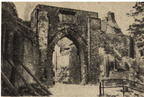
Ryc. 163. Pasłęk, brama miejska.

wego gmachu w ten sposób, by nie ucierpiało na tym piękno zabytkowej architektury. Przy tej okazji będzie można oczyścić zamek z nowszych poniemieckich dobudówek, których spalone mury szpecą zamek.