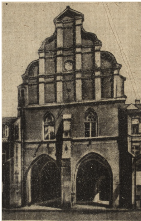
Ryc. 164. Pasłęk. Ratusz przed zniszczeniem.

Krajobraz zabytków na obszarze województwa pomorskiego nie uległ wskutek działań wojennych zasadniczym zmianom. Ocalały w nim przede wszystkim wielkie zespoły historyczno-architektoniczne jak w Toruniu, Chełmnie, Włocławku, Nowem Mieście, Brodnicy, Bydgoszczy, Lubawie, Nieszawie. Na ok. 600 obiektów zabytkowej architektury całkowicie zniszczonych zostało 15-cie (w tym 6 kościołów drewnianych z XVII i XVIII w.), a 82 obiekty (przeważnie sakralne) doznały mniejszych uszkodzeń (od 2—50%) lub większych zniszczeń (od 50—90%). W tych ostatnich mieszczą się duże skupiska zabytków Grudziądz (34) i mniejsze w Chojnicach (4) i Świeciu (2). W skali zniszczeń wysokoprocentowych (na miarę znanych dewastacji innych miast polskich) Grudziądz zajmował pierwsze miejsce; jego gotycka (z XIII/XIV/XV w.) fara p. w. św. Mikołaja, wielki blok 25 spichrzy nad Wisłą, (z XIV—XVIII w.), barokowy kościół oo. Jezuitów (z l. 1648—1715), gotycki (w zrębie murów) kościół p. w. św. Ducha wraz z d. klasztorem Benedyktynek i pałacem Opaterek (z XVII/XVIII w.) zostały wraz z innymi budynkami o cha-