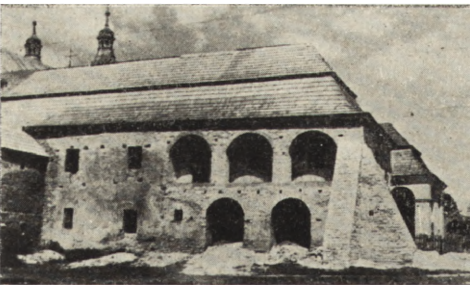
Ryc. 83. Kazanów — woj. kieleckie. Otwarta loggia.

Z bombardowania w 1944 r. ocalała część ścian potrzaskanych i powychylanych z pionu. Pozwoliło to jednak w oparciu o przedwojenne materiały inwentaryzacyjne na opracowanie całkowitej rekonstrukcji zabytku.