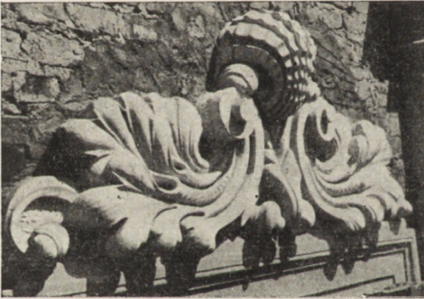
Ryc. 82. Zamek Ostrogskich. Zrekonstruowane nadproże okienne.