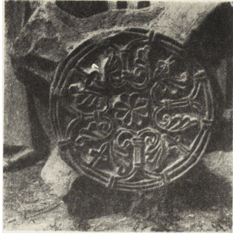
Ryc. 73. Jędrzejów — zwornik z XIII w. z b. kapitulacza cysterskiego znaleziony w 1948 r.