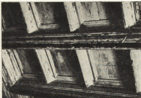
Ryc. 78. Szydłowiec — zamek. Odkryty strop drewniany.

później dr F. Przypkowski w oknie piwnicznym jednego z domów w Jędrzejowie. Posiadają one roślinną płasko rzeźbioną dekorację o typie rozetowym i wraz ze znajdującymi się od 1913 r. w Muz. Nar. w Krakowie innymi relikwiami z tego kapitułarza stanowią ciekawy zespół, który daje wyobrażenie o bogactwie form występujących w jego obrębie. Nie małą też rewelacją jest odkryta w r. 1948 we Włostowie, w glicach zamurowanego dotąd okienka pn. ściany prezbiterium, polichromia romańska (ryc. 76) o motywach w kształcie śmig, niewątpliwie pozostająca w jakimś związku z późno-romańską XIII-wieczną polichromią kościoła św. Jakuba w Sandomierzu. Być może, że również z tego okresu pochodzi polichromia na kapitelach prezbiterium kościoła w Mokrzku, odsłonięta na skutek odpadnięcia tynków spowodowanego wstrząsami w czasie ostatnich działań wojennych 1) . Ostatnie odkrycie w tej dziedzinie stanowią malowidła figuralne na łuku tęczowym w kościele św. Trójcy w Jędrzejowie — XVI-wieczne, które w roku bieżącym mają być całkowicie odsłonięte.