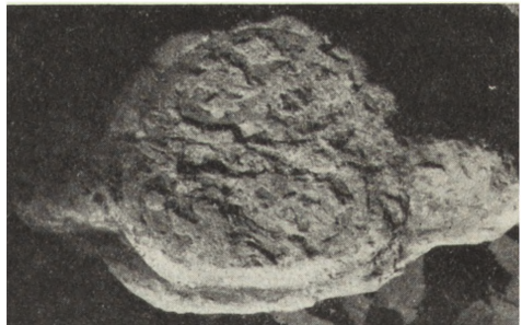
Ryc. 74. Jędrzejów — zwornik z XIII w. z b. kapitulacza cysterskiego znaleziony w 1949 r.

Przede wszystkim położono nacisk na szybkie doprowadzenie obiektów zabytko-