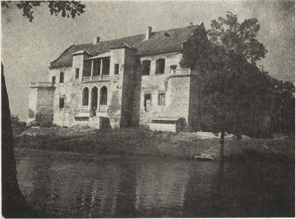
Ryc. 75. Szydłowiec — zamek po zrekonstruowaniu logii w 1951 r.

wych do stanu użytkowego, aby mogły jak najprędzej pełnić funkcję społeczną. Tak więc do końca 1952 r. przewiduje się zakończenie robót przy kamienicy Oleśnickich w Sandomierzu z XVI w. — ciekawej ze względu na zachowane podcienia — przeznaczonej na Muzeum P.T.T.K., ratuszu z XVI w. w Szydłowcu, w którym obradować będzie Miejska Rada Narodowa, w zamku w Szydłowcu (ryc. 75), gdzie mieścić się będzie szkoła zawodowa, bursa oraz przy budynkach poklasztornych pod Sulejowem z XIII w., nadających się ze względu na obszerność na schronisko P.T.T.K. i szkołę. Wcześniej, bo już z wiosną b. r. po przeprowadzeniu remontu wewnątrz udostępniony zostanie dla celów turystycznych klasztor na Łysej Górze z XVII w. — dawniejsze więzienie. Poddany został również pracom konserwatorskim XV-wieczny zamek w Drzewicy, który mimo że zachował się stosunkowo w dobrym stanie, dotychczas nie znalazł użytkownika, jak też i dwór murowany z XVI w. w Skotnikach, w przyszłości siedziba Gm. R. N.