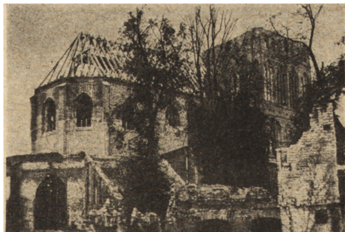
Ryc. 203. Kośc. paraf. w Świdwinie. Zakładanie więzania dachowego w r. 1947.

niejące już poprzednio miejskie organizmy słowiańskie. We wszystkich podanych wypadkach jedynie kilka monumentalnych obiektów zabytkowych, w lepszym lub gorszym stanie zachowanych, wznosi się ponad dziesiątkami hektarów bezkształtnych