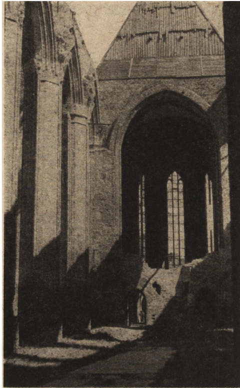
Ryc. 202. Wnętrze katedry w Kołobrzegu podczas rekonstrukcji. Stan z r. 1952.

niejące już poprzednio miejskie organizmy słowiańskie. We wszystkich podanych wypadkach jedynie kilka monumentalnych obiektów zabytkowych, w lepszym lub gorszym stanie zachowanych, wznosi się ponad dziesiątkami hektarów bezkształtnych