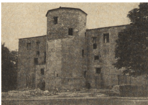
Ryc. 196. Pn. elewacja zamku w Słupsku z nadbudowaną wieżą. Stan z r. 1952.