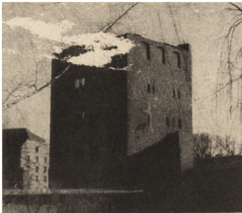
Ryc. 198. Brama Młyńska w Słupsku od pd. Stan w 1951 r.

Słupsk. Zamek książęcy z XVI w. po wymarciu dynastii książąt pomorskich został w XVIII w. doszczętnie ograbiony, a w 1815 r. po rozbiciu wieży przez piorun uległ gruntownej przeróbce: wyburzono wszystkie sklepienia i ściany, zamurowano wielkie okna przebijając szereg nowych, malutkich dostosowanych do nowego podziału na piętra przez pomosty drewniane, w rodzaju młyńskich. Nadbudowano IV piętro i ścięto wieżę — całość pokryto wysokim dachem w 1821 r. (ryc. 197). Zamek tak urządzony służył różnym celom: był arsenałem, magazynem zbożowym. mieścił wytwórnice sieci itp. W r. 1951 silne zapadnięcie się dachu, a jednocześnie uruchomienie arterii komunikacyjnej w bezpośrednim sąsiedztwie zamku, skłoniło do przeprowadzenia prac zabezpieczających. Rozebrano olbrzymi ciężki dach kryty dachówką i zdjęto IV nadbudowane piętro. Całość przykryto dachem prowizorycznym, o systemie kratownic, półpłaskim pod papą, opartym na ścianach zewnętrznych. Pozwala to na prowadzenie robót wewnątrz gmachu. Dobudowano ściętą część wieży rekonstruując ją według zachowanych fragmentów (ryc. 196) i kryjąc również prowizorycznym dachem. Wewnątrz wieży zachowały się schody