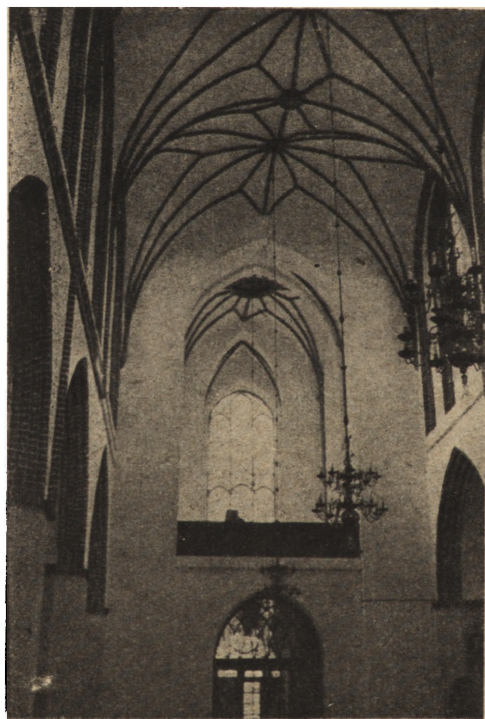
Ryc. 201. Odbudowane wnętrze kośc. Mariackiego w Słupsku w r. 1950. Widok na chór muzyczny.

murowano narożnik południowo zachodni nawy bocznej. Zamurowano okna i drzwi. Masyw ściany zachodniej utworzony z połączonych wież w XV w., od XVII w. umacniany ściągamami, obecnie po pożarze i bombardowaniu, gdy wszystkie ściągi popękały — rysuje się coraz bardziej i odchyła z pionu w narożniku południowo-zachodnim.