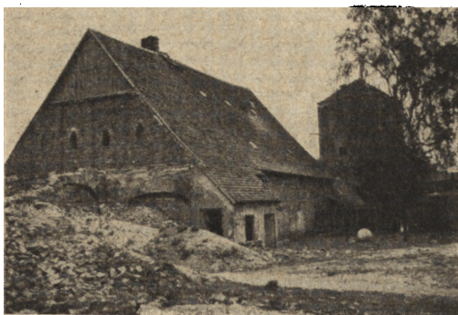
Ryc. 195. Młyn zamkowy w Słupsku z odbudowanym szczytem; w głębi Brama Młyńska. Stan z r. 1952.