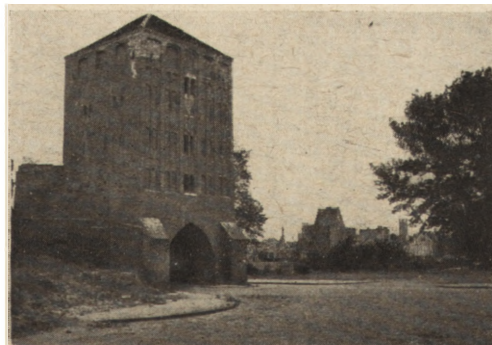
Ryc. 199. Brama Młyńska w Słupsku od pd-wsch., zabezpieczona i pokryta w 1952 r.

3. Konserwacja architektury sakralnej. Kołobrzeg—katedra z XIV w. Działania wojenne zniszczyły dachy, sklepienia runęły, wypaliło się wewnątrz (rys. 202) i zawaliło jedyne zachowane dotąd w Polsce lektorium. W 1946—48 przykryto dachem stałym prezbiterium i uzupełniono sklepienie. Prowizorycznie zasłoniono szczyt (od nawy) deskami. Odgruzowano wewnątrz i pod-