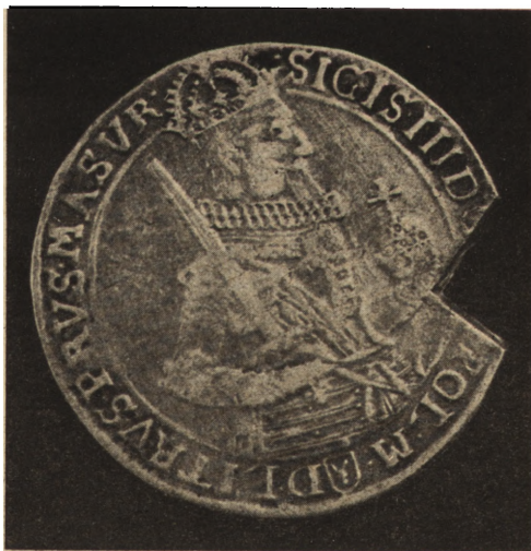
Ryc. 228. Medal srebrny Zygmunta III-go.

Kielich ten odznacza się pięknym kształtem, delikatnym ornamentem i rysunkiem.