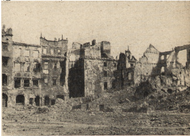
Ryc. 192. Rynek St. Miasta w r. 1945. Widok w kierunku Krzywego Koła.