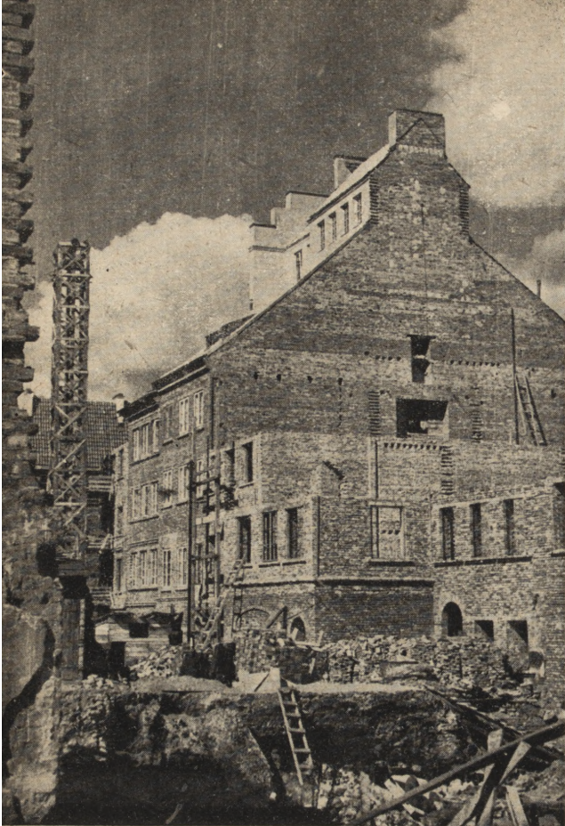
Ryc. 197. Odbudowa St. Miasta. Fragment ul. Piwnej w r. 1951.

Rok 1950. W pierwszych miesiącach 1950 r. z pracowni Staromiejskiej wychodzi I seria projektów i rys. roboczych kamienic staromiejskich i rozpoczyna się odbudowa na wielką skalę. W robocie są kamienice w Ryńku po stronie Dekerta, Kołłątaja i na jej zapleczu od ul. Piwnej, cała nieparzysta strona Piwnej, część Piekarskiej i Szerokiego Dunaju.