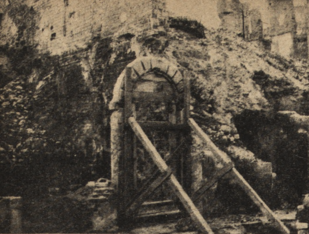
Ryc. 194. Zabezpieczenie ocalałego portalu. Rynek nr 8. Stan w r. 1946.

piono do robót zabezpieczających kamienicę w Ryнку St. Miasta Nr 28, 30, 32, 34, 36, 38, 40, 42 i 31. Szczególnie ważne i niebezpieczne prace wykonano przy kamienicach Nr 38, 40, 42, które mocno ucierpiały od pamiętnego huraganu z marca 1946. We wrześniu, październiku i listopadzie pod kier. mgr inż. W. Podlewskiego opracowano szczegółowy plan zabudowy Starego Miasta. Plan ten stał się podstawą do dalszych opracowań i został w końcu zrealizowany bez większych zmian.