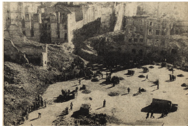
Ryc. 193. Rynek St. Miasta w r. 1945. Pierwsze prace społeczne nad odgruzowaniem.