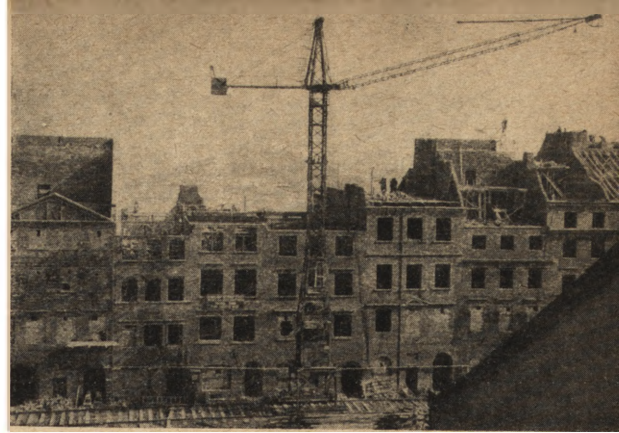
Ryc. 198 i 199. Odbudowa Rynku. Stan w marcu 1953.

A) Stare i Nowe Miasto w najbliższych planach odbudowy Warszawy wchodzi jako zespół zabytkowy mający być zrealizowany w formie tzw. «Traktu Starej Warszawy» i obejmuje pas zabudowy staromiejskiej od Placu Zamkowego do ul. Konwiktorskiej (długości ok. 1000 m.) i od ul. Brzeczowej do ul. Piwnej (szerokości ok. 150–200 m). W pasie tym wszystkie elementy zespołu