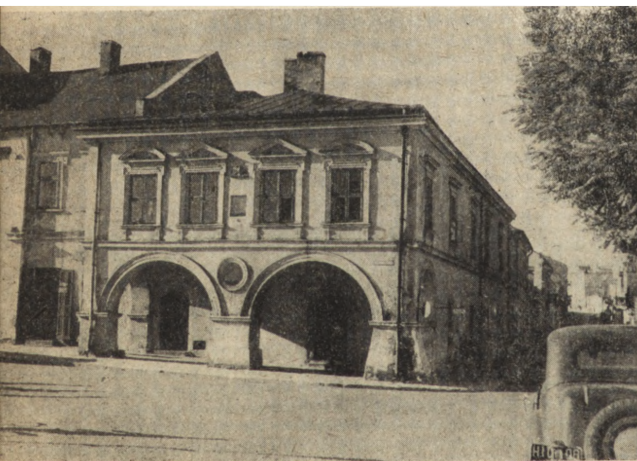
Ryc. 135 i 136. Zachowane domy podcieniowe w dawnym rynku.

Niżej podpisana posiadata wraz z dziećmi Dom murowany w Mieście Kielcach przy Ulicy Rynek pod N-m 237 przed którym były arkady składające się z 4-ch wielkich murowanych filarów i sklepienia z jednej strony na filarach, z drugiej na murze domu opartego — arkady te formowały tak zwane podcienie z którego za skład towarów w czasie Jarmarków i targów