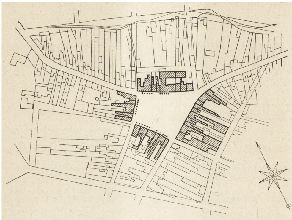
Ryc. 132. Wycinek z planu Kielc z r. 1823, kopia z r. 1830 w W. A. P. Kielce. rys. Ziemińska