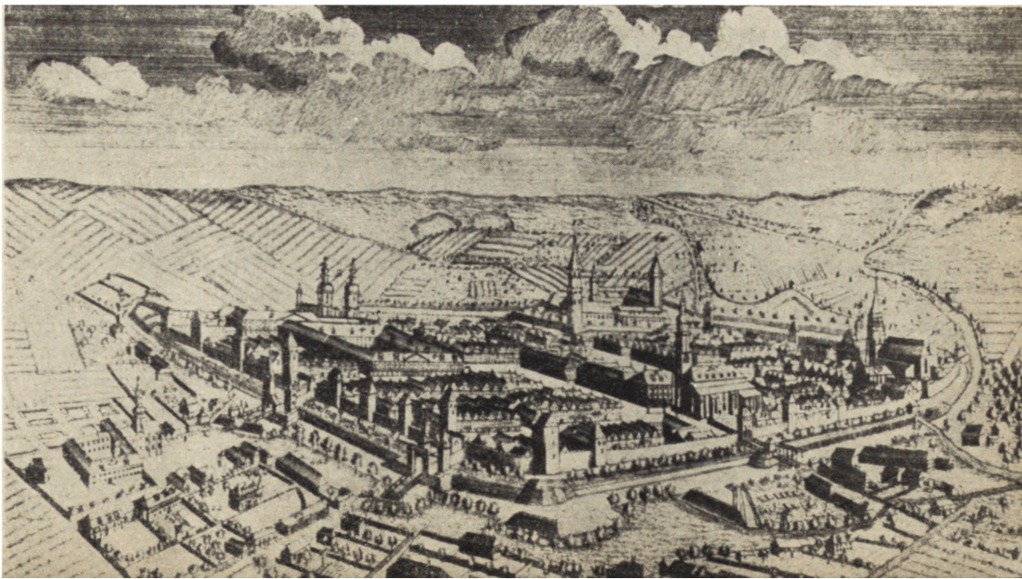
Ryc. 138. Legnica — widok miasta w końcu XVIII w.