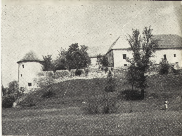
Ryc. 139. Žumberk, widok na fortyfikacje wiejskie po częściowej konserwacji.

Kazimiera Chojnacka, Z kartografii pomorskiej XVII wieku. „Przeegl. Zach.,” VII, 1951, t. I, nr 1—4, str. 270—