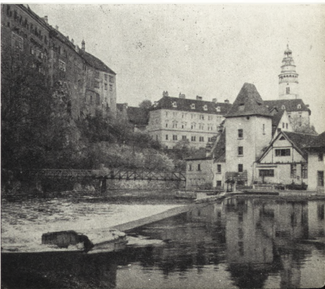
Ryc. 141. Český Krumlov.