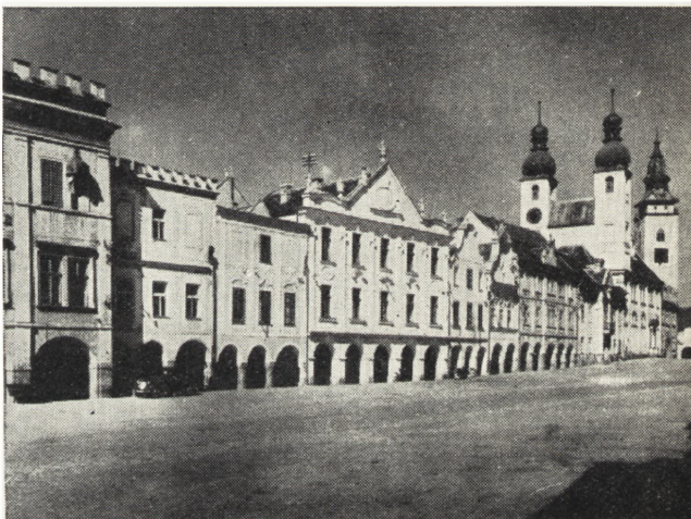
Ryc. 140. Telč, rynek. Stan po całkowitym odnowieniu.