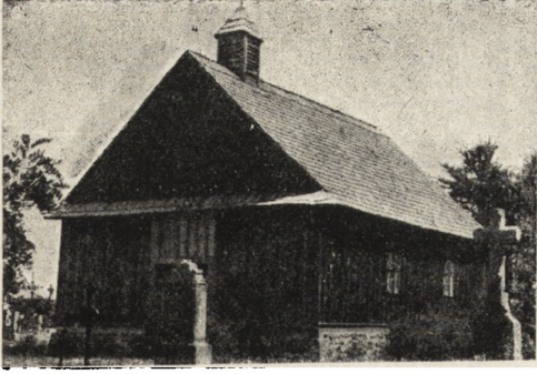
Ryc. 250. Kościół cmentarny w Węgrowie.

/SŁAWETNYCH/ /JAKUBA HVEYS/ /Y EL- ZBIETY CAMPBELOW/ /MAŁŻONKÓW/ /JEŚLI- BYM CZEGO OCZEKIWAŁ/ /GRÓB BĘDZIE DOMEM MOIM/ /OB XVII. V. 13/ /AB 1696/ /AD 1700/