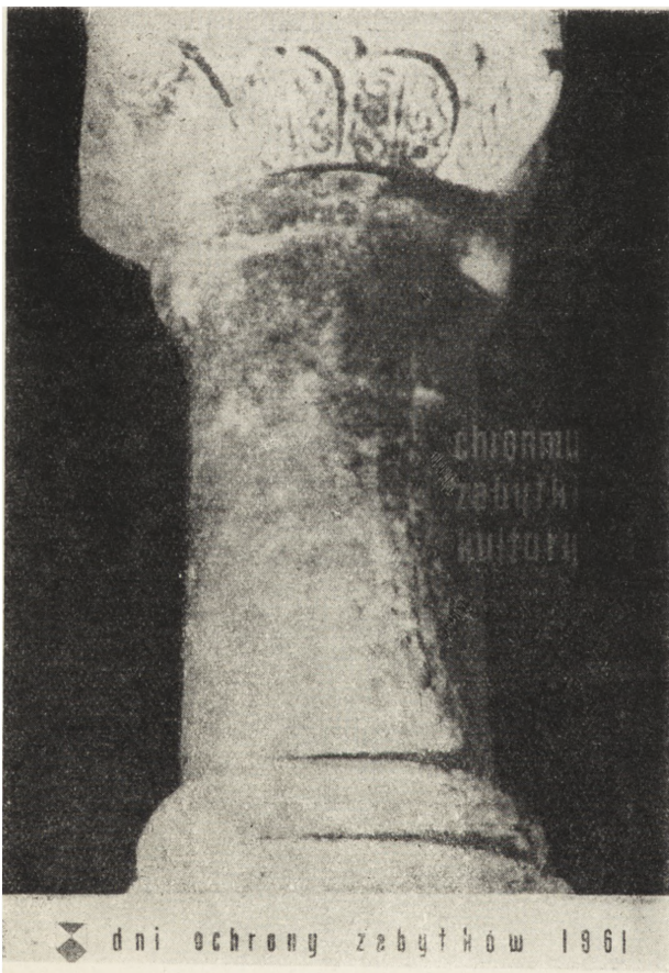
Ryc. 1. Plakat na „Dni Ochrony Zabytków” wg projektu S. Zagórskiego, wyd. Ministerstwo Kultury i Sztuki.

W maju bieżącego roku zostały po raz szósty zorganizowane doroczne, ogólnopolskie „Dni Ochrony Zabytków”, których zadaniem jest pogłębianie wiedzy o zabytkach i zainteresowanie całego społeczeństwa ich ochroną. Dla skoncentrowania akcji popularyzacyjnej przyjęto miesiąc maj, także i dlatego, że w tym okresie odbywają się przygotowania do letniego sezonu turystycznego; przedstawienie w czasie „Dni” walorów turystycznych i piękna zabytków nie pozostaje bez wpływu na wprowadzenie tej tematyki do programów turystyczno-krajoznawczych.