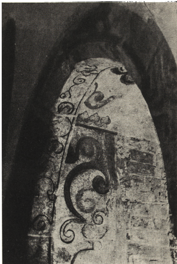
Ryc. 9. Wodzisław Śląski. Kościół pominorycki, odkryte malowidło na podłuczcu i ościeżach portalu — widok od strony wschodniej. Stan po konserwacji

stosowaniem trzydziestu jeden motywów ornamentalnych: roślinno-kwiatowych, tekstylnych, geometrycznych, nielicznych zwierzęcych (ptaki, jelonki, sarny) oraz heraldycznych (orły). Ponadto, używając patronu literowego, powtórzono w tekście gotyckiej kilkakrotnie wezwanie modlitewne „HILF GOT MARIA BEROT”. Efekt wielobarwnej (głównie czerni, białej, zieleni i cynamonu) polichromii podnoszą trzy, wykonane odrębnie, motywy figuralne, z których wyróżnia się wizerunek patronki kościoła, św. Katarzyny (ryc. 8). Wykonane przez Laboratorium Główne PKZ Warszawa badanie belek ścian i desek kruchty południowej, przy użyciu lampy kwarcowej, nie ujawniło wcześniejszej polichromii, poza czytelną, fragmentarycznie zachowaną (XVII w.?) złożoną z czarnych splotów roślinnych. Konieczne odczyszczenie i utwalenie malowideł oraz kolorystyczne scalenie ubytków podobrazia uczytelnią wartość późnogotyckiej polichromii stropów, którą należy odnieść do okresu wzniesienia obecnej budowli czyli ok. 1534 roku. Dokonane odkrycie ma poważne znaczenie ze względu na nie zachowanie się bliskich czasowo lub formalnie zabytków śląskich, a zarazem jako dowód dalszych związków artystycznych, szczególnie z Małopolską.