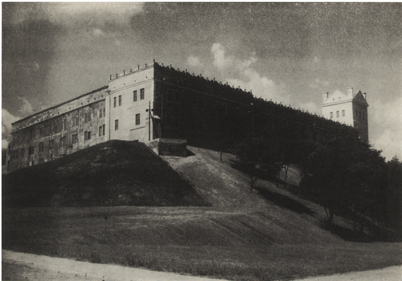
5. Szczecin. Zamek książąt piastowskich