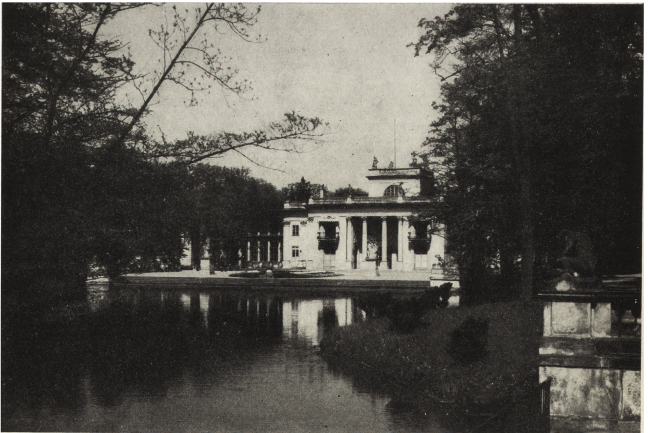
4. Warszawa. Pałac na Wodzie w Łazienkach