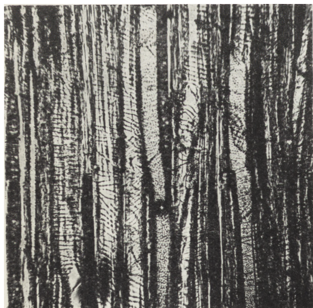
2. Przekrój styczny drewna lipy, powiększenie mikroskopowe.

2. Section tangente du bois de tilleul. Agrandissement microscopique