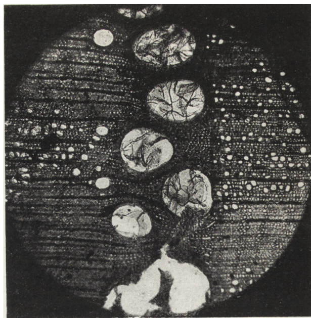
3. Przekrój poprzeczny drewna dębu, powiększenie mikroskopowe.

1. Section transversale du bois de tilleul. Agrandissement microscopique