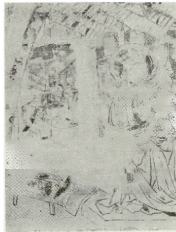
1. Strzelnicy koło Brzegu, kościół filialny, prezbiterium, ściana południowa, fragment sceny Pokłonu Trzech Króli: NM Panna i św. Józef w warsztacie stolarskim; stan po konserwacji wykonane bez uzupełnień