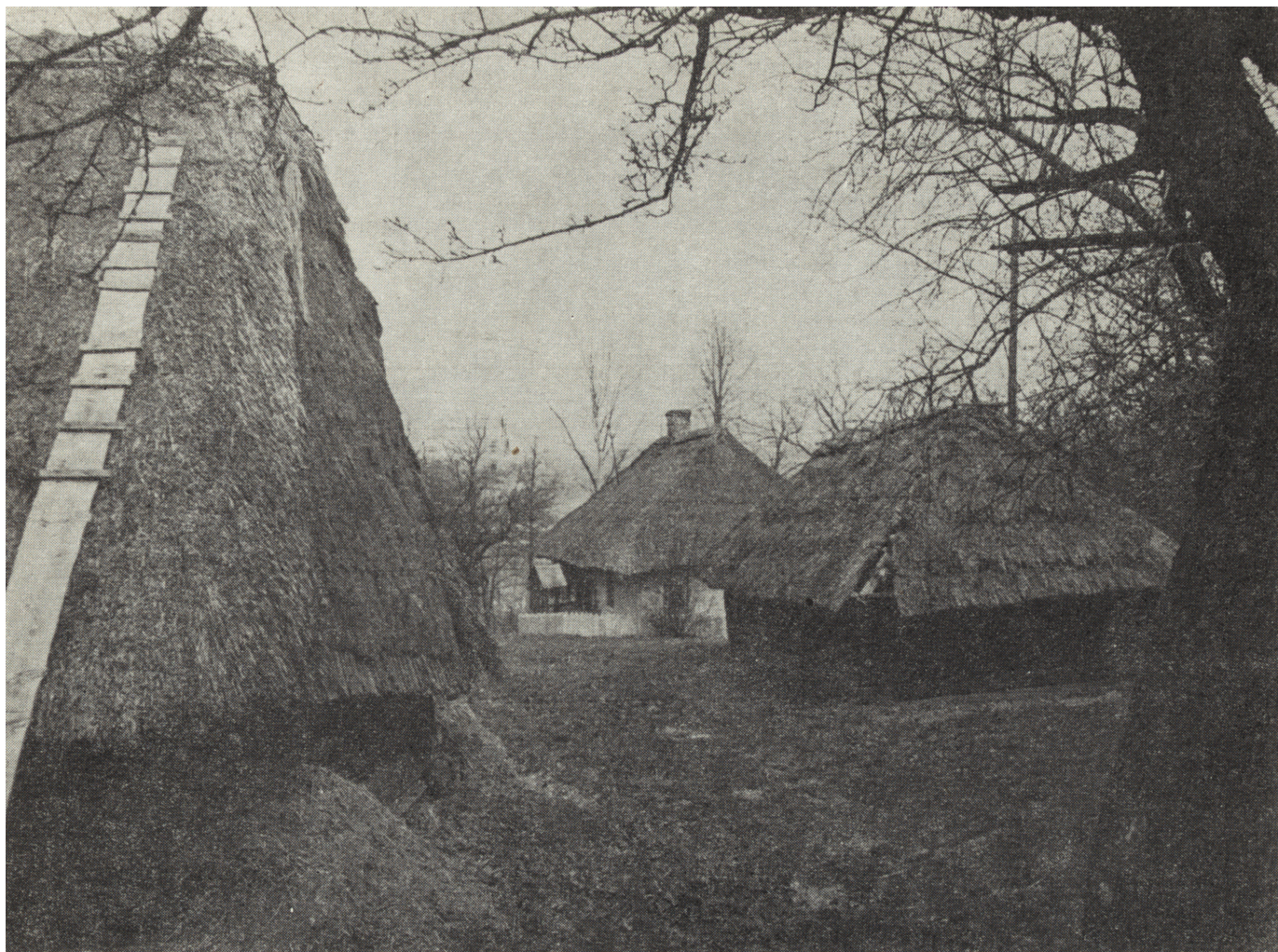
3. Zagroda Orczyków w Sułoszowej, fragment zabudowy 3. The Orczyk family farmstead at Sułoszowa, a section of built-up area

cach leży wieś Sułoszowa, z racji swych rekreacyjnych i turystycznych funkcji, jak również konieczności zachowania dawnych form zabytkowego budownictwa charakterystycznych dla Doliny Prądnika — jest miejscem szczególnie predestynowanym do rozwijania tego rodzaju form ochrony. Są one uwzględnione w planie przestrzennego zagospodarowania OPN. Niestety praktyczna realizacja słusznych form ochrony napotyka wiele przeszkód natury finansowej i wykonawczej. Toteż zagroda Orczyków jest na tym terenie swoistym precedensem, pierwszą konkretnie zrealizowaną inicjatywą, która pozwoli na przetrwanie zagrożonym zabytkom.