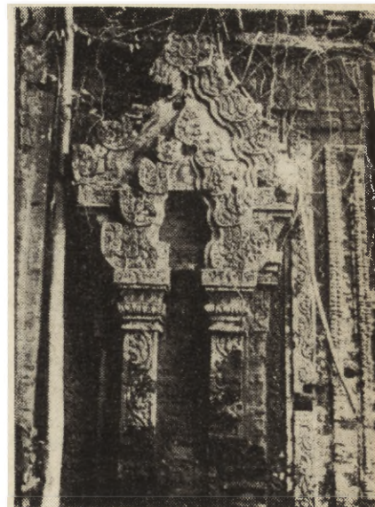
3. Fragment dekoracji rzeźbiarskiej wieży z XIV w.

cze na początku wieku było trzysta, dzisiaj pozostało ich tylko około trzydziestu; zostały w większości zniszczone w wyniku działań wojennych. Wieże, o wysokości dochodzącej nawet do 28 m, znajdują się najczęściej na terenach górzystych, a wykonane zostały w nieokreślonej do dnia dzisiejszego technologii łączenia cegieł. Brak jest tradycyjnego wątku ceglano-łączącego zaprawą wapienną; hipoteza zakłada stosowanie specjalnego (nie zidentyfikowanego) kleju. Mimo wieloletnich badań prowadzonych przez uczonych francuskich zagadka ta nie została wyjaśniona. Może wyjaśnią ją Polacy, którzy skłaniają się raczej do innej hipotezy: że obiekty stawiano z surowej cegły, a następnie je wypalano.