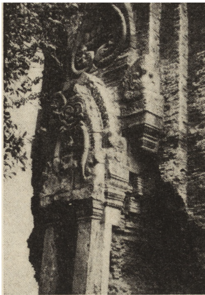
2. Portal kamienny wieży z XII w.