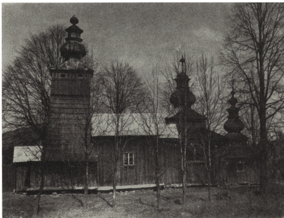
2. Świątkowa Mała, woj. krośnieńskie, widok elewacji