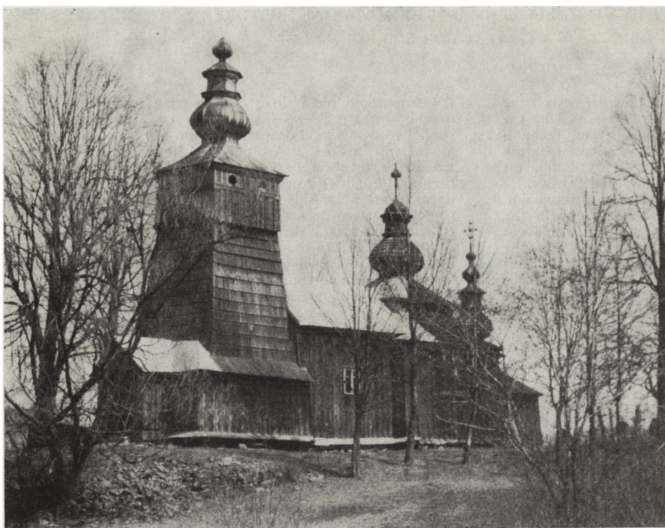
1. Świątkowa Mała, woj. krośnieńskie, cerkiew drewniana, widok ogólny