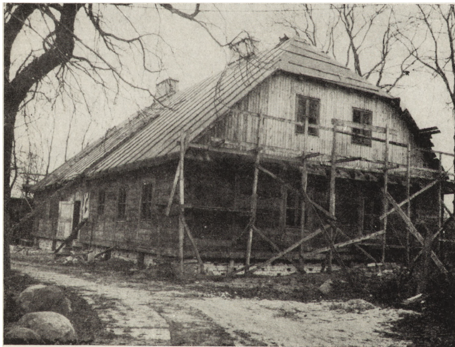
2. Radziejowice, gmina Radziejowice, drewniany dwór klasycystyczny z ok. 1782 r.

fialny Św. Apostołów Piotra i Pawła, gotycko-renesansowy, zbudowany w pierwszej połowie XVI w. (prawdopodobnie w 1518 r.). W 1558 r. wzniesiono nowe szczyty, jednonawowy z konchowymi absydami, ślepymi arkadami przyściennymi, sklepieniem kolebkowym z płaskim ornamentem geometryczno-sieciowym, szczyty z motywem blend gotyckich. Wewnątrz nagrobki Sobockich oraz malowidła ścienne Zofii Boddain. W latach 1979—1980 dokonano częściowej wymiany więźby dachowej i pokrycia dachowego z ceramicznego na blachę miedzianą, impregnację drewna, częściowe licowanie murów, wykonano konserwację po-