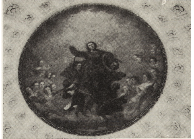
6, 7. Skierniewice, polichromie ścienne z kościoła Św. Jakuba — stan po konserwacji

liwinyłowym oraz zabezpieczono pastą woskową. Wykonano rekonstrukcję kolorystyczną cokołu. Wykonawca — mgr Jadwiga Wardzyńska z zespołem z Pracowni Konserwacji Malarstwa PKZ Oddział w Warszawie; inwestor — Wojewódzki Konserwator Zabytków w Skierniewicach.