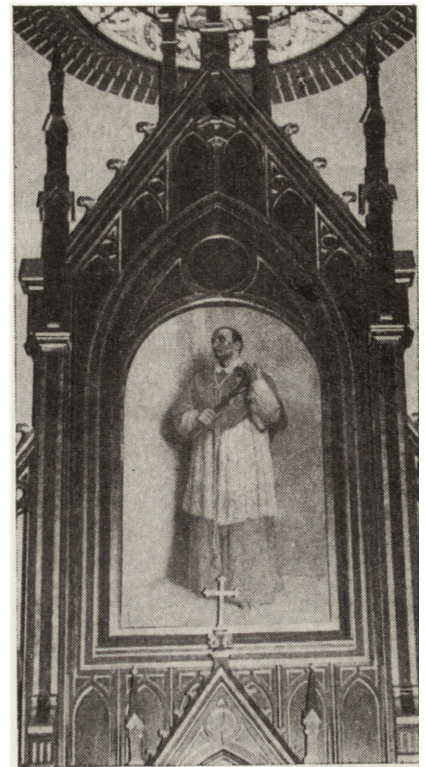
8. Zyrardów, obraz „Św. Boromeusza” z kościoła parafialnego pod tym samym wezwaniem, XIX w. — stan po konserwacji

„Sztandar PKW ZSL” z Muzeum Ziemi Rawskiej, z 1949 r., wykonany z adamaszku jedwabnego o dużych motywach kwiatowych, barwiony na kolor czerwony i zielony, nici jedwabne, barwione na różne kolory, bajorek metalowy w kolorze srebrnym i złotym, galon w kolorze złotym. Spękane nici odstają i wysuwają się, laseta odstaje od podłoża, ubytek jednego rogu sztandaru. Całość tkaniny zabrudzona. W toku prac konserwatorskich w 1979 r. po demontażu wycięto podszewkę i częściowo ją