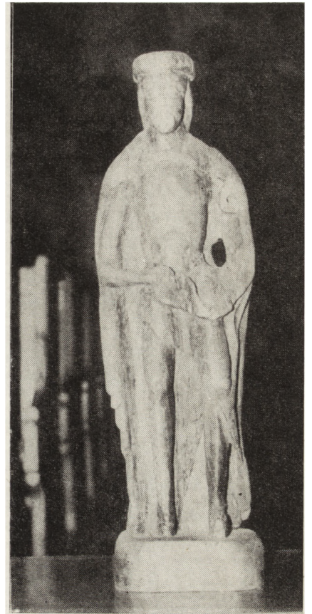
3, 4, 5. Nikołajew, gmina Teresin, rzeźby drewniane z kościoła Św. Jana i Pawła — stan po konserwacji

Janisławice, gm. Głuchów. Kościół parafialny Św. Małgorzaty, wzniesiony na przełomie XV/XVI w., przebudowany w XIX w. i powiększony w 1922 r., jednonawowy, z kruchtą, stropy płaskie z pozorowanymi półkolebkami i barokowymi ołtarzami. W 1981 r. przeprowadzono remont więźby dachowej, wymianę pokrycia dachowego ze starego gontu na nowy na kościele i dzwonnicy. Prace z kredytów użytkownika, częściowo dofinansowane przez Ministerstwo Kultury i Sztuki z Uchwały Nr 179/78, prowadzone systemem gospodarczym. Radziejowice, gm. Radziejowice. Dwór (dom administratora) stanowi nierozdzielalną całość z zespołem pałacowym, zbudowany około 1782 r., klasycystyczny, drewniany, parterowy z mieszkalnym poddaszem, z gankiem o czterech kolumnach zwieńczonym trójkątnym dachem. W 1979 r. PKZ Oddział w Warszawie na zlecenie użytkownika — Ministerstwa Kultury i Sztuki przystąpił do przeprowadzenia remontu kapitalnego wraz z adaptacją. Prace są kontynuowane.