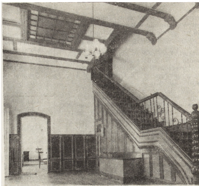
2. Fragment wnętrza zespołu dworskiego w Piotrowie (gm. Brodnica)

waniem terenu wokół zabytkowych obiektów.