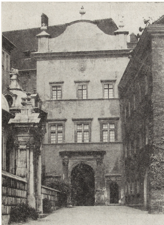
1. Fasada budynku bramnego Zamku Królewskiego na Wawelu – stan przed konserwacją, czerwiec 1985 r.

1. The facade of a gate building in the Royal Castle at the Wawel Hill – condition before conservation, June 1985