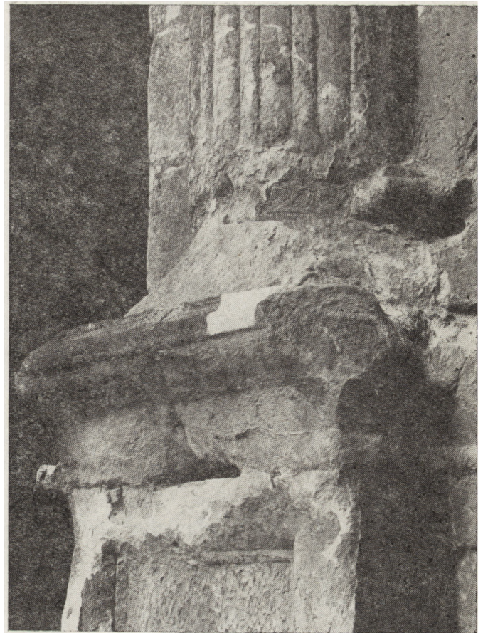
3. Fragment dolnej części portalu Berrecciego z lewej strony – stan przed konserwacją. Widoczne ubytki kamienia i jego destrukcja w partii bazy kolumny, czerwiec 1985 r.

3. Detail of the lower part of Berrecci's portal on the left side – condition before conservation. To be seen missing parts of the stone and its destruction in part of column's base, June 1985