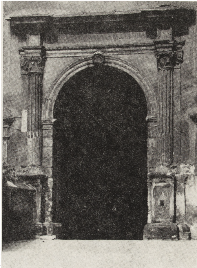
2. Portal Berrecciego z fasady budynku bramnego Zamku Królewskiego na Wawelu przed konserwacją

1. The facade of a gate building in the Royal Castle at the Wawel Hill – condition before conservation, June 1985