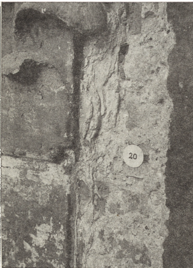
6. Fragment obrzeża portalu Berrecciego przy kapitelu i górnej części trzonu prawego półpilastra – stan w trakcie badań konserwatorskich, czerwiec 1986 r.

5. Part of the cornice of the left socle of Berrecci's portal – condition during conservation studies. The probing bar in the wall adjoining the object, June 1986