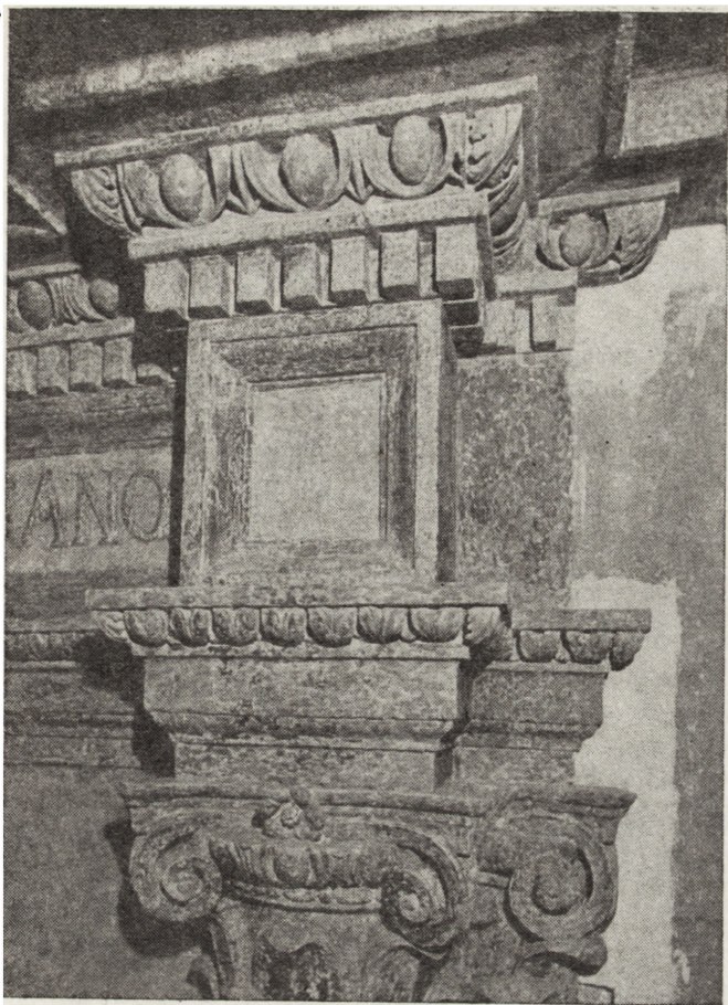
7. Fragment górnej części portalu Berrecciiego strona prawa – stan w trakcie scalania kolorystycznego, wrzesień 1986 r.

7. Part of the top part of Berrecci's portal, right side – condition during colouristic integration, September 1986