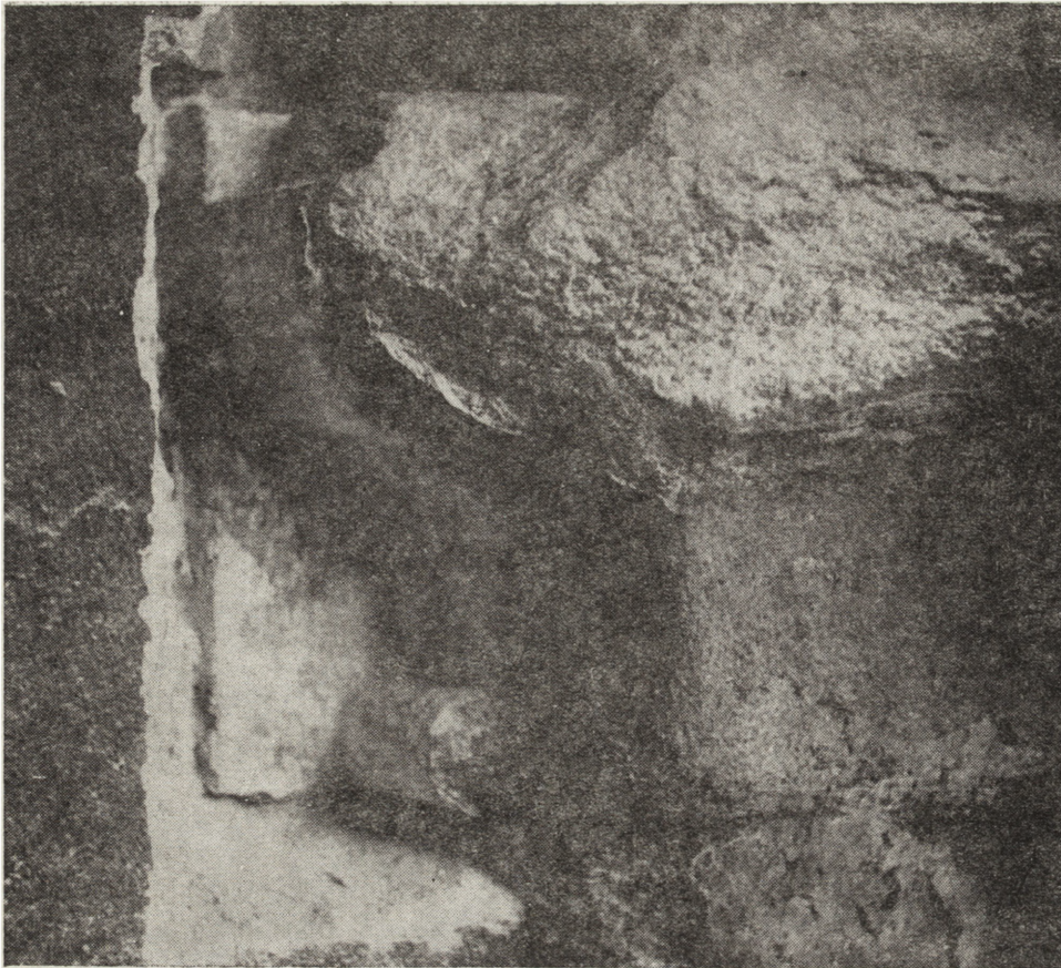
5. Fragment gzymsu lewego cokolu portalu Berrecciego – stan w trakcie badań konserwatorskich. Sonda w murze przylegającym do obiektu, czerwiec 1986 r.

5. Part of the cornice of the left socle of Berrecci's portal – condition during conservation studies. The probing bar in the wall adjoining the object, June 1986