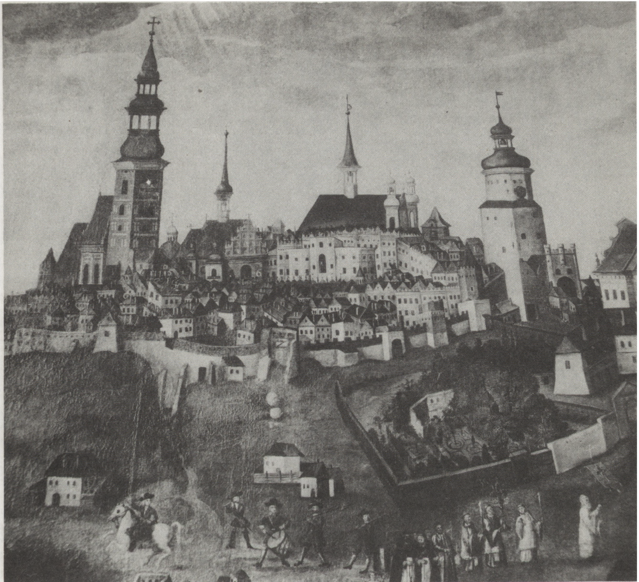
1. Widok miasta od zachodu z połowy XVIII w. Fragment obrazu „Pożar Lublina w 1719 r.” 1. View of the city from the west, the middle of the 18th cent. Fragment of painting „The Fire of Lublin in 1719”

podziemi. Prace te, w trakcie których wykonywano od kilku do kilkunastu wykopów w obrębie jednej posesji, przeprowadzono najpierw w kamienicach przy ulicy Grodzkiej 3, 5 i 5A, a później w całym bloku VIII.