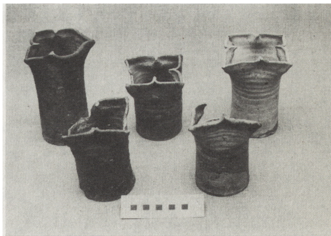
5. Fragment zespołu średniowiecznych kafli garnkowych odkrytych obok kamienicy przy ul. Grodzkiej 28 5. Fragment of set of medieval kitchen pot tiles discovered near the house at Grodzka 28

W latach 1986 i 1987 podpisano tylko jedną umowę na prace badawcze. Dotyczyła ona prac w bloku XIV. Formułując program tych badań, wykorzystano doświadczenia lat poprzednich. Jego opracowywanie rozpoczęto od analizy dokumentacji naukowo-historycznych w celu określenia problemów badawczych. Jednocześnie zwrócono się do inwestora o przesłanie programu badań geotechnicznych. W programie prac przewidziano założenie wykopów archeologicznych w celu rozstrzygnięcia zasadniczych problemów oraz rozwiązanie mniej