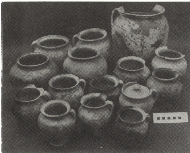
4. Zespół naczyń glinianych z XIV–XV w. odkrytych w podwórku kamienicy przy ul. Grodzkiej 5 4. 14th-15th cent. earthenware discovered in courtyard of the house at Grodzka 5

próbę prześledzenia przebiegu muru obronnego w bloku VI oraz próbę określenia przebiegu wodociągu staropolskiego na ul. Rybnej podjętą w trakcie badań bloku VII.