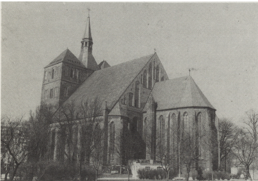
6. Kolobrzeg, kolegiata XIII/XIV w. — widok od południowego wscho- du