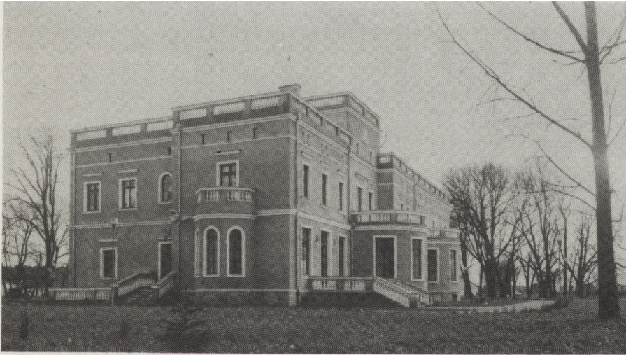
5. Pietronki, pałac z XIX w.