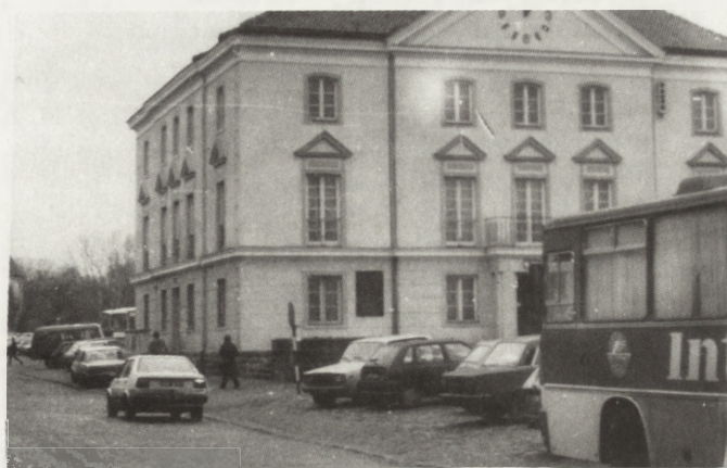
Ratusz w Pułtusk