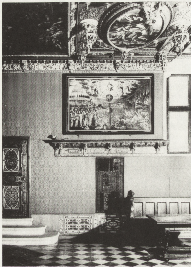
2. Sala Czerwona Ratusza Głównego Miasta w Gdańsku. Ściana północna z wmontowaną w latach siedemdziesiątych XX w. intarsjowaną boazerią.

nad zabytkami. Pojawia się termin „restauracja” rozumiany jako przywracanie zabytkom dawnego (nieko-niecznie pierwotnego) stanu. W przeciwieństwie więc do epok poprzednich działania na „zabytkach przeszłości” miały być „zabiegiem świadomym, będącym wynikiem pietyzmu dla zabytków i ich historycznego wartościowania 21 .