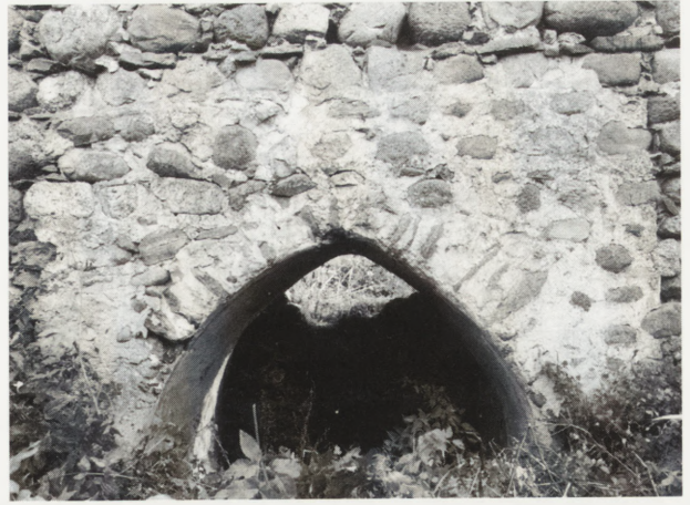
6. Ostrolukowy otwór wejściowy w ścianie zachodniej. 6. Ogival entrance in west wall.

Lata następne nie przyniosły dalszych działań zmierzających do przeprowadzenia niezbędnych prac budowlanych, choćby zabezpieczających najbardziej narażone na zniszczenie fragmenty konstrukcji zamku. Pociągnęło to za sobą dalszą dewastację substancji zabytkowej. Przede wszystkim wpłynęło na ciągle zmniejszanie się grubości ścian pod betonową płytą dociskową na skutek erozyjnego działania wód opadowych. Przyczyniło się również do osuwania się