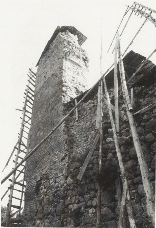
5. Ruiny zamku — wieża północna, stan obecny.