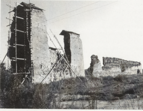
4. Ruiny zamku. 1996 r.