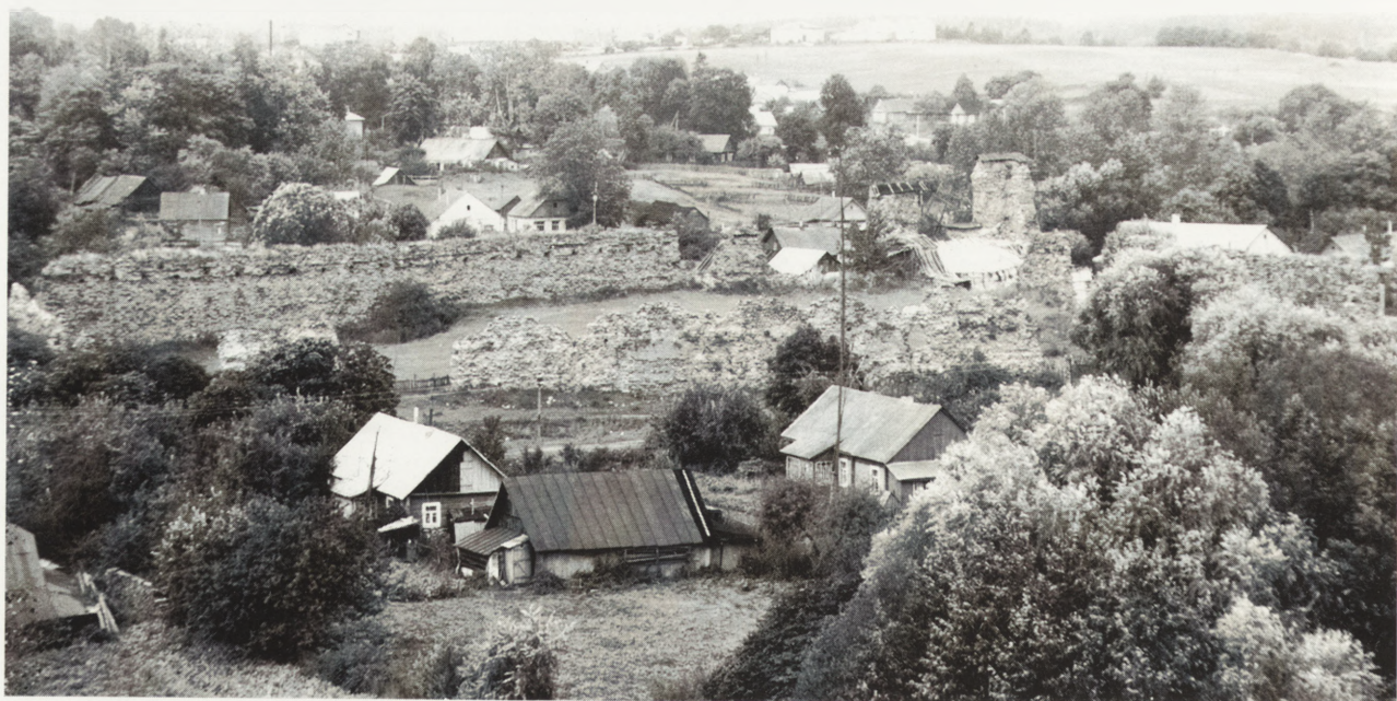
1. Krewo — ruiny zamku. Fot. T. Polak, 1996 r.

z pozostałych zaś łakami, które dawniej zapewne zalane wodą, zabezpieczały twierdzę od napaści. Pozostałe do dziś mury obwodowe mogły mieć z górą 20 łokci (11,5 m) wysokości 1 i obejmowały znaczną przestrzeń, która zdolna była pomieścić w razie wojny wielką liczbę chroniącej się ludności, wojska i dobytku, a w czasie pokoju obok składów, budynki mieszczące liczną czeladź księcia i administratorów 2 . Twierdze podobne stanowiły typ przejściowy pomiędzy zamkiem całkowicie drewnianym a całkowicie murowanym. Budowle wewnątrz murów były dziełem cieśli i murarzy, a murowane wieże nie stanowiły tu części zasadniczej, choć w przypadku zamku w Krewie to one decydują o jego osobliwości. Oprócz bowiem wieży mniejszej, kryjącej się wewnątrz narożnika południowego, twierdza posiadała w narożniku północnym naprzeciwległą, znacznie większą mieszkalną wieżę książęcą. Wystawała ona gigantycznym blokiem graniastosłupowym na zewnątrz murów obwodowych, flankując w ten sposób ścianę zachodnią i północną, w której zlokalizowana była brama główna zamku. Wnioskując z ocalałych resztek, ciągle jeszcze widocznych podziałów i liczby istniejących kiedyś kondygnacji, można przyjąć, że pierwotna wysokość wieży książęcej wynosiła