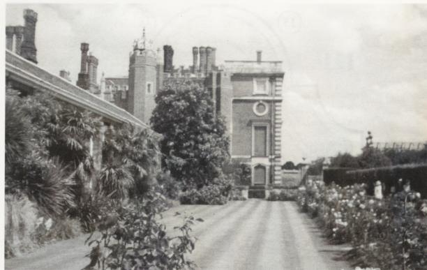
2. Widok na południowo-zachodnie skrzydło Hampton Court Palace i rosarium.

Niewątpliwie jest to największa całościowa rekonstrukcja ogrodu w XX w. w Europie. Zrealizowano ją ogromnym nakładem pracy i środków. Efekty są równie wspaniałe. Sądzę jednak, że jest to wynikiem nie tylko możliwości organizacyjno-finansowych twórców, ale też ogromnej „kultury ogrodniczej”, z której słynie społeczeństwo Wielkiej Brytanii. Aranżacja ogrodu jest bowiem nie tylko przyjemnością, ale też i wielką sztuką, że wspomnę tylko o niezwykle wysublimowanej poetyce ogrodów Zen. Dlatego też bez zaskoczenia oglądałam tłumy Anglików spieszące na coroczny Hampton Court Palace Flower Show, gdzie Królewskie Towarzystwo Botaniczne rozstrzyga konkurs na najpiękniejszy ogród wystawy spośród kilkudziesięciu propozycji. W 1997 r. Grand Prix otrzymał ogród, który był po prostu łąką z kilkoma makami, kamie-