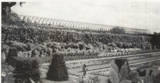
3. Widok na Wielką Altanę królowej Marii od strony Ogrodu Wodnego Henryka VIII