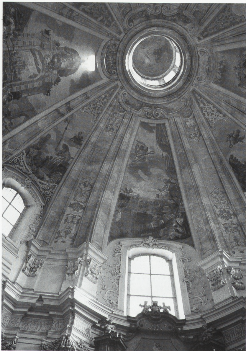
Łąd, klasztor pocysterski. Polichromie J. Neuhertza w kopule kościoła, stan po konserwacji.

Najstarsza część ob. kościoła zbudowana została z fundacji Jana i Bartłomieja Lubstowskich w 1534 r., natomiast w poł. XVIII w. dokonano gruntownej przebudowy — wówczas uzyskał wyposażenie rokokowe.