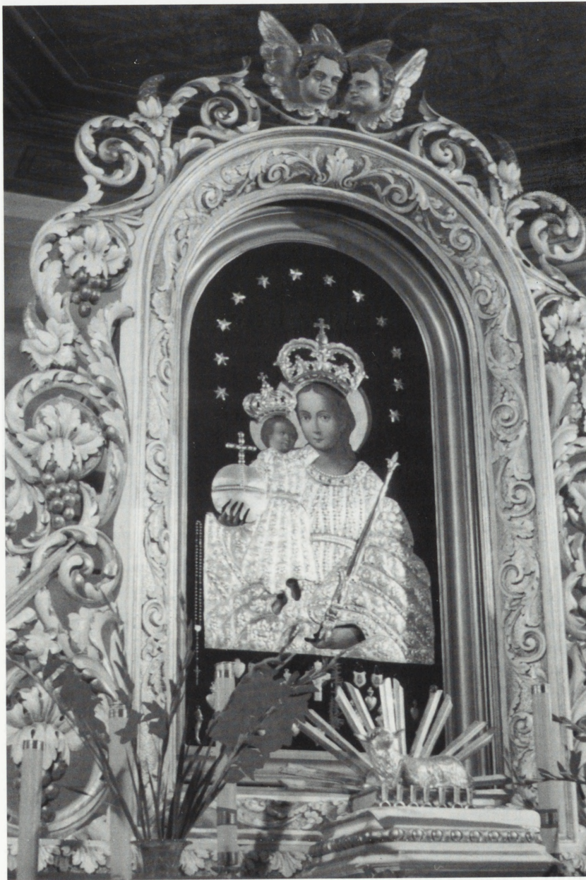
Makolno, kościół p.w. św. Andrzeja Apostoła — obraz cudowny MB z Dzieciątkiem, 2 poł. XVII w., po konserwacji.

Zdecydowano, że polichromia na stropie nawy pochodząca z k. XIX w. (neobarokowa) zostanie zachowana po zdjęciu przemalo-