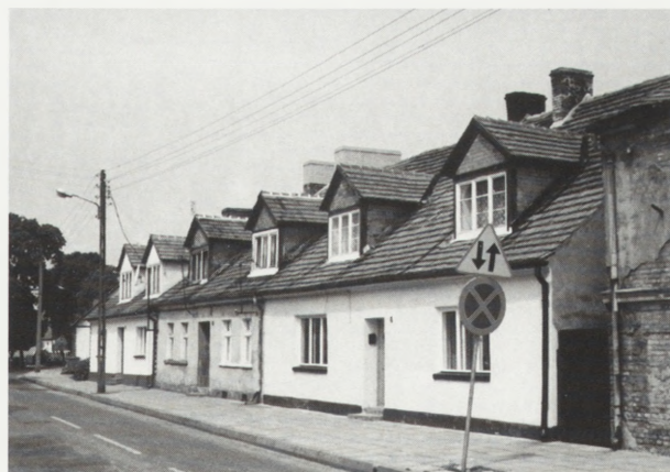
7. Międzyrzecz. Domy przy ul. Winnica