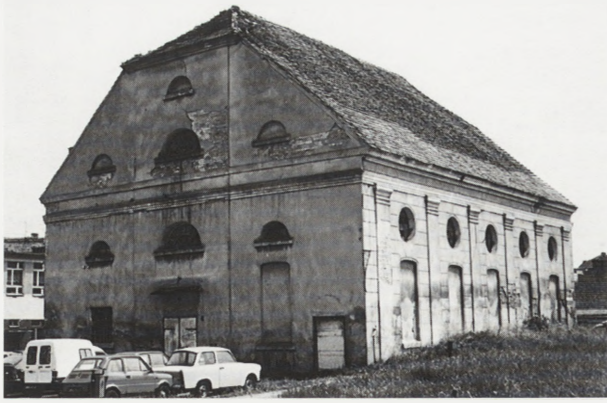
3. Międzyrzecz. Synagoga, widok od południowego zachodu