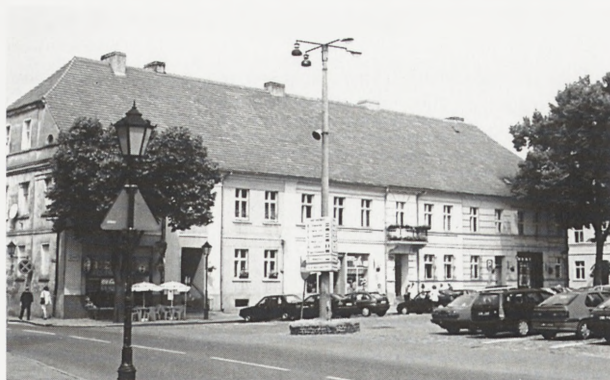
5. Międzyrzecz. Kamienice zachodniej pierzei rynku

Większość tych domów pozbawiona jest znaczniejszych walorów artystycznych i indywidualnej formy architektonicznej. Występując w zespole tworzą one jednak dość interesujący kompleks o specyficznym wyrazie architektonicznym i jako takie — stanowią cenny zabytek urbanistyczno–architektoniczny 11 . W ostatnich latach staraniem władz miejskich część kamieniczek została odremontowana, inne czeka to w najbliższej