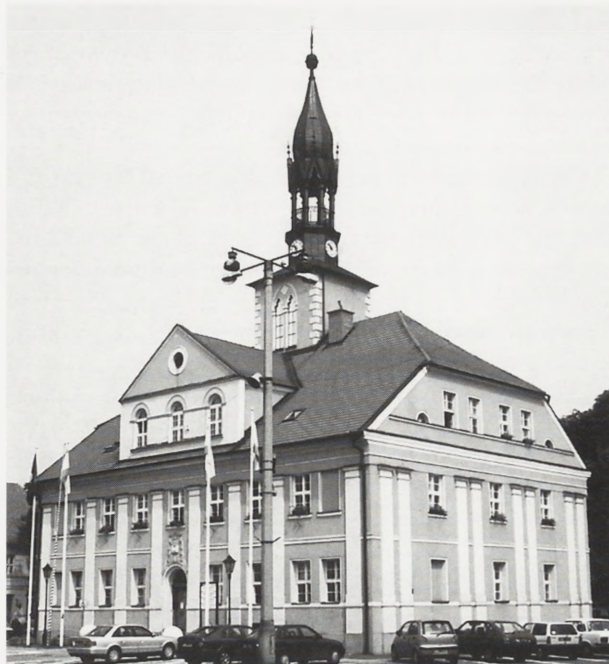
1. Międzyrzecz. Ratusz, widok od południowego wschodu. Wszystkie fot. K. Jodłowski, 2001 r.

Po pożarze ratusz przez pewien czas pozostawał w ruinie. Odbudowę rozpoczęto w 1743 r., za kadencji burmistrza Jacoba Kinzla seniora, kontynuowano ją za jego następców. Prace, obejmujące wykonanie nowych murów piętra, dachu oraz wzniesienie wieży po stronie wschodniej, zakończyły się w 1752 r. Odbudowę kierowali Jacob Kinzel senior i Jacob Roestel; zaangażowano do niej mistrza murarskiego Johanna Gottlieba Drokerja, prace ciesielskie wykonał Johann