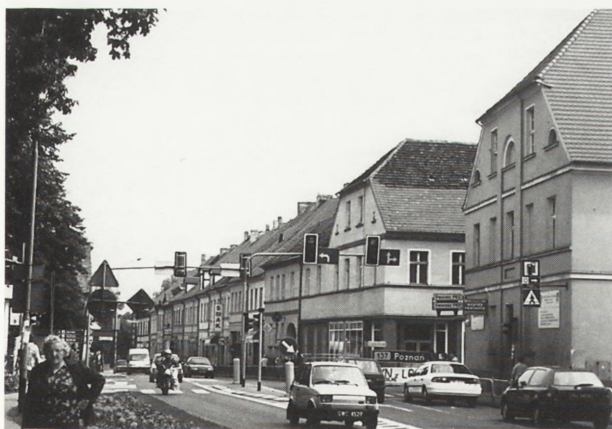
6. Międzyrzecz. Kamienice zachodniej pierzei ul. Waszkiewicza

Budowle te mają także niebagatelne walory estetyczne. Na tle dość monotonnej architektury współczesnej stanowią one niepowtarzalne akcenty krajobrazowe, decydujące o indywidualnym charakterze miasta. Wszystkie wymienione względy uzasadniają potrzebę badań naukowych poświęconych zabytkom Międzyrzecza, a także nakazują otoczenie ich troskliwą opieką.