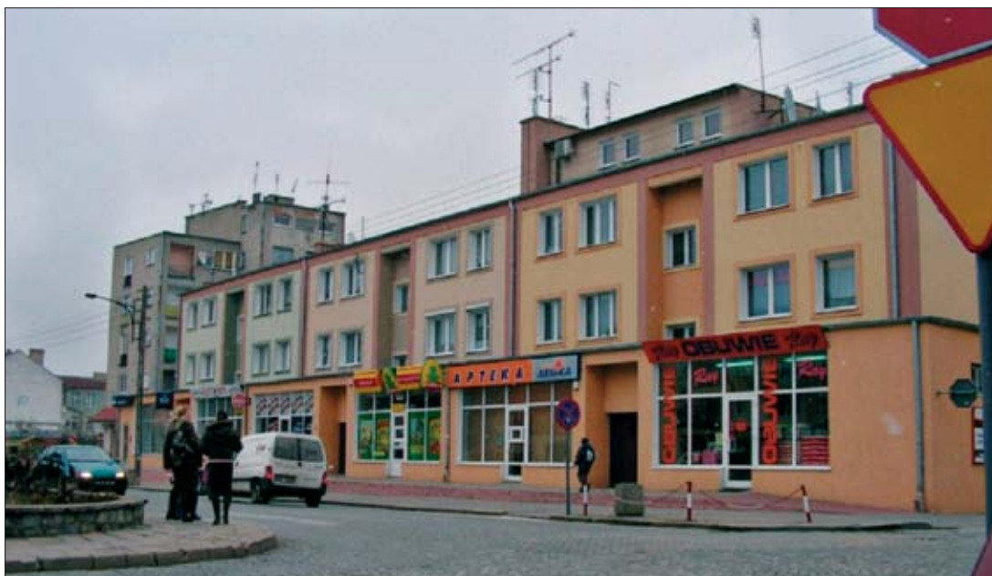
15. Olsztyn. Nowoczesna zabudowa na staromiejskim Rynku, wrzesień 2008 r.