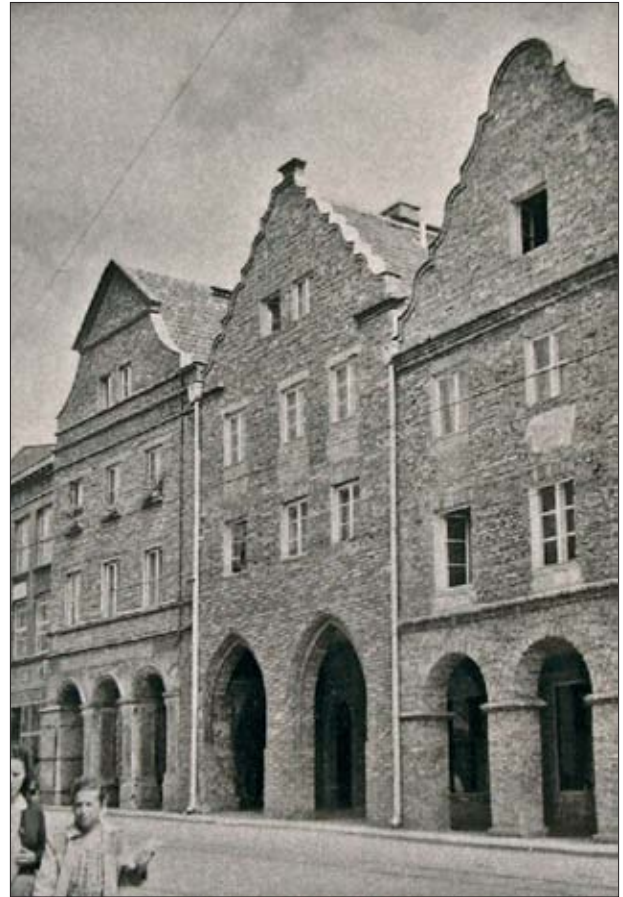
6. Odbudowane kamienice pierzei wschodniej nr 10-12. W kamienicy nr 10 widać pozostawioną przedwojenną podcieni. Fot. J. Żurawski, sierpień 1957, zbiory Archiwum WUOZ w Olsztynie.

6. Reconstructed houses no. 10-12 in the eastern row. House no.10 features a preserved pre-war arcade. Photo: J. Żurawski, August 1957, collections of the Archive of the Voivodeship Office for the Protection of Historical Monuments in Olsztyn.