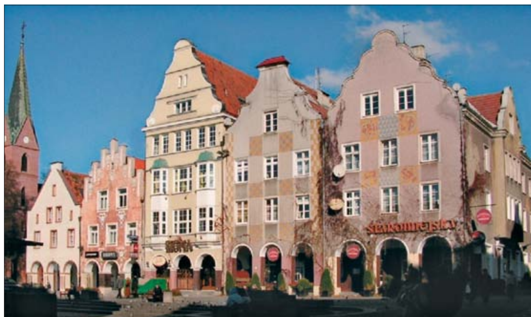
11. Northern row of houses – view from the inter-war period and after reconstruction. State from September 2008.

on jednak na uwagę, gdyż było to pierwsze i w zasadzie jedyne opracowanie dotyczące rewaloryzacji i restauracji całego olsztyńskiego Starego Miasta wraz z jego otuliną, z zawartą inwentaryzacją, analizami, szeregiem studiów i wytycznymi konserwatorskimi. Autorzy planu nie wskazują jednego historycznego punktu odniesienia dla prac rewaloryzacyjnych; określają cele prac jako podkreślenie i wydobywanie elementów najstarszych oraz uwydatnienie klimatu i nastroju wnętrza urbanistycznych z okresu historycznego, w jakim powstała zachowana zabudowa. Ciekawe są też wnioski dotyczące Rynku Staromiejskiego, pokazujące podejście architektów i konserwatorów do powojennej kreacji w końcu lat 70.