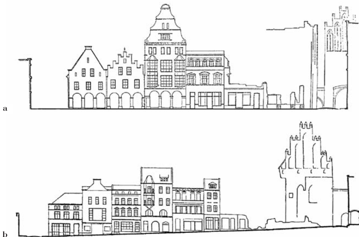
2. Stan ruin pierzei północnej (a) i zachodniej (b) Starego Miasta, 1945. Rys. H. Adamczewska.

2. State of the ruins of the northern (a) and western (b) row of houses in the Old Town, 1945. Drawing: H. Adamczewska.