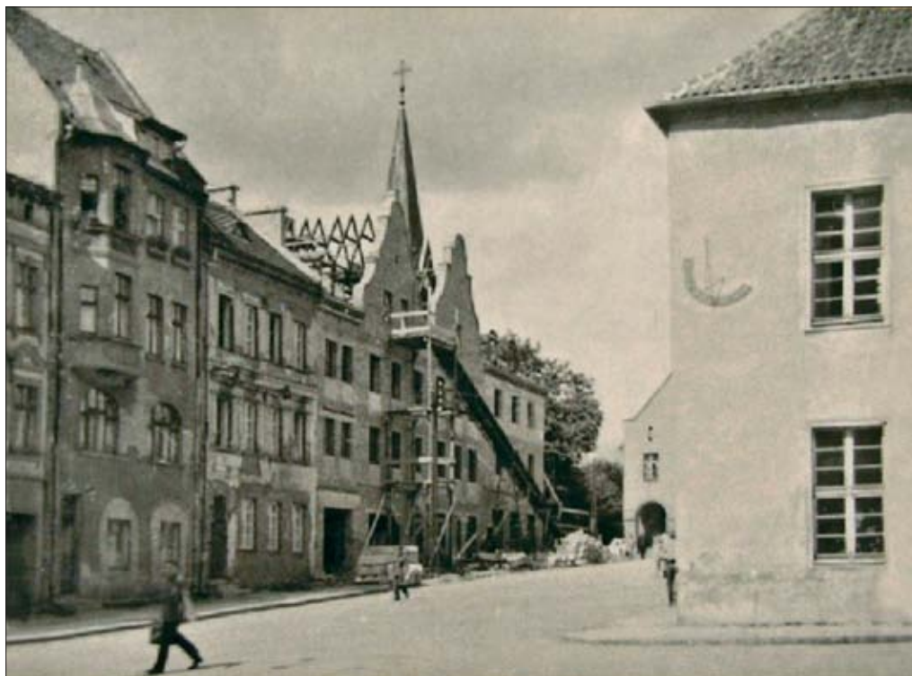
9. Budowa kamienic pierzei zachodniej, arch. Edward Michalski, Kazimierz Wójcik, sierpień 1957 r.

9. Construction of the western row of houses, architect Edward Michalski, Kazimierz Wójcik, August 1957.