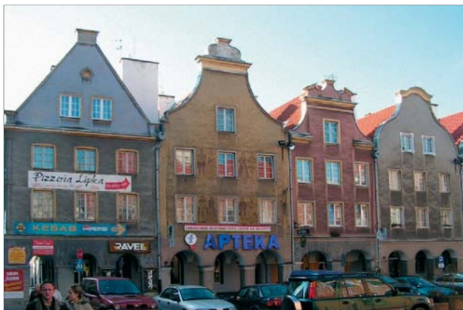
13. Pierzeja południowa – widok sprzed wojny i po odbudowie. 13. Southern row of houses – view from the inter-war period and after reconstruction.