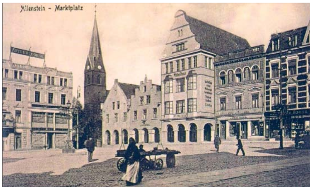
11. Pierzeja północna – widok sprzed wojny i po odbudowie. Stan z września 2008 r.