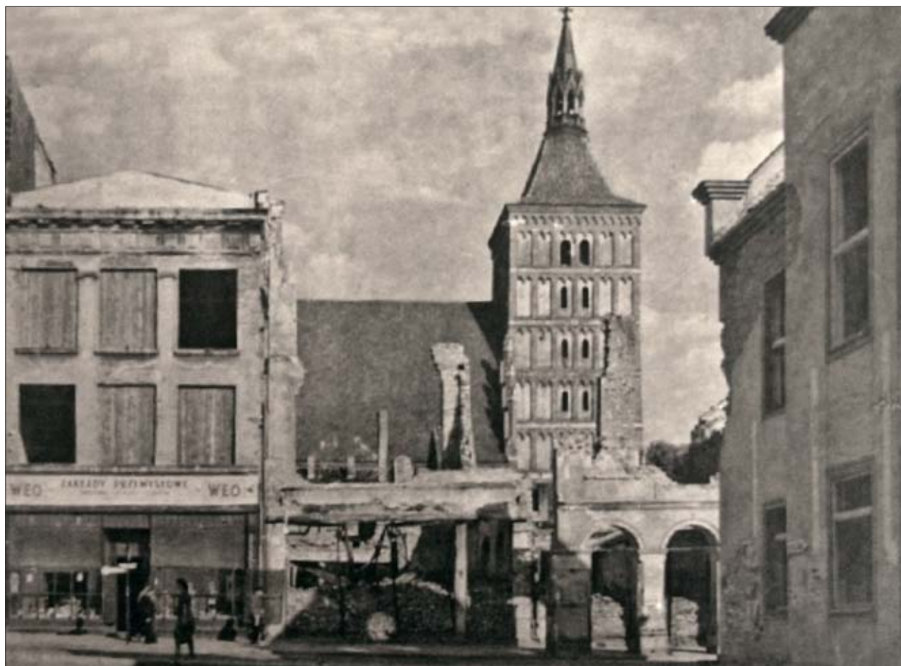
1. Zniszczenia Starego Miasta – widok na pierzeję wschodnią, domy nr 8, 9, 10. W głębi kościół św. Jakuba. Fot. J. Bulhak, 1945, zbiory Archiwum WUOZ w Olsztynie.