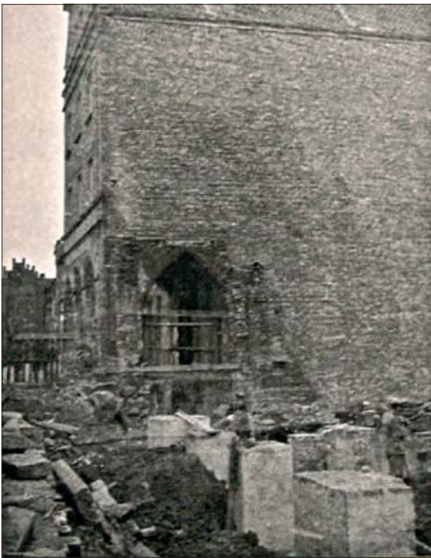
5. Przygotowania do odbudowy domu nr 11. W głębi odbudowany dom nr 10 z zachowanym ostrołukowym podcieniem. Fot. C. Vetulani, 1955, zbiory Archiwum WUOZ w Olsztynie. 5. Preparations for the reconstruction of house no. 11. In the background: house no. 10 with preserved ogival arcade. Photo: C. Vetulani, 1955, collections of the Archive of the Voivodeship Office for the Protection of Historical Monuments in Olsztyn.

Szczegółowe projekty co do ukształtowania Rynku były następujące: w pierzei północnej przeprojektowano elewacje do jednolitego układu szczytowego (ryc. 4a); w pierzei wschodniej założono, że budynki budowane od nowa są kalenicowe, oprócz budynków skrajnych (il. 4b). Budynek nr 10 z łukami renesansowymi miał zostać odbudowany na zachowanych fundamentach z zachowaniem istniejącej podcieni. W budynku nr 11 (tzw. „Burmistrzówka”) – na podstawie opracowań niemieckich – założono odtworzenie I kondygnacji w pierwotnej formie; pozostałe kondygnacje – w sposób nawiązujący do rynku. Pierzeję południową podzieloną na cztery elementy zaprojektowano od nowa (il. 4d) (całkowicie zniszczona); w pierzei zachodniej zakładano budynki kalenicowe, z wyjątkiem trzech, które ze względu na głębokość (ok. 30 m) pokryte miały