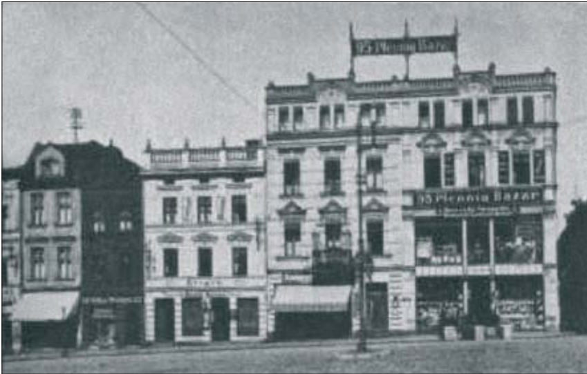
14. Północna część pierzei zachodniej – widok sprzed wojny i po odbudowie.

14. Northern part of the western row of houses – view from the inter-war period and after reconstruction.