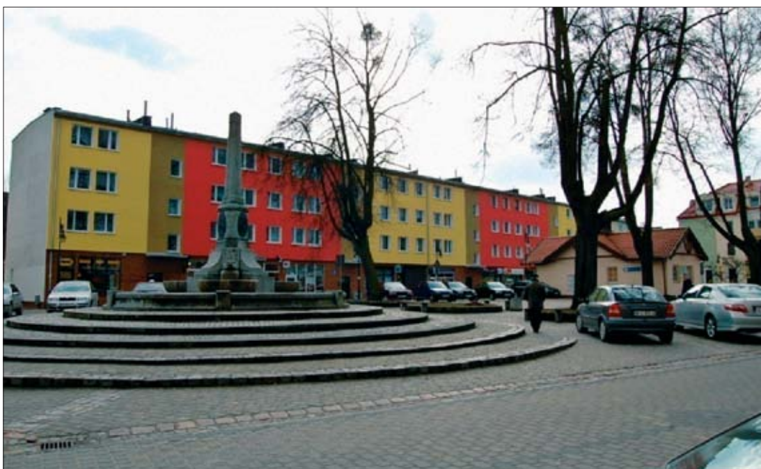
16. Ostróda. Nowoczesna zabudowa na staromiejskim Rynku. Na pierwszym planie Fontanna Trzech Cesarzy z 1907 r., zrekonstruowana w 2004 r., marzec 2009 r.

jawi się on jako jednorodna koncepcja realizująca architekturę historyzującą z zachowaniem ocalałej, przedwojennej architektury i z zachowaniem w większości historycznych podziałów i linii regulacyjnych 49 . Świadczy to o wyczuciu osób odpowiedzialnych za odbudowę Rynku, aby w miarę możliwości i na miarę dostępnych środków przywrócić klimat Starego Miasta, tym bardziej że ograniczone finanse i brak mieszkańcy opowiadałyby się za architekturą prostą i taną, wykorzystującą prefabrykaty, która zaspokoiłaby ówczesne potrzeby i historia Warmii, zagadnienia konserwatorskie w sztuce sakralnej. Nauczyciel historii sztuki.