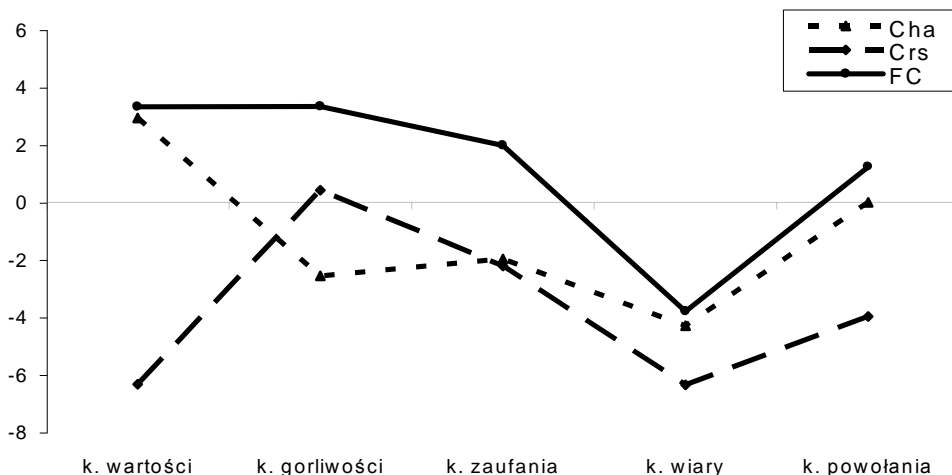
Wykres 2. Poczucie zmiany siebie w skalach Cha, Crs i FC w grupach wyodrębnionych z uwagi na typ kryzysu

Obecność mniej lub bardziej intensywnego momentu niepewności, czy też nieadaptacyjności podczas formacji zakonnej w znaczącym stopniu modyfikuje proces nabywania kompetencji do życia zakonnego. Treściowa specyfika obszaru, który podlega kryzysowi, wprowadza dodatkowe zróżnicowanie w zakresie poczucia zmiany w obrazie siebie, w procesie formacyjnym.