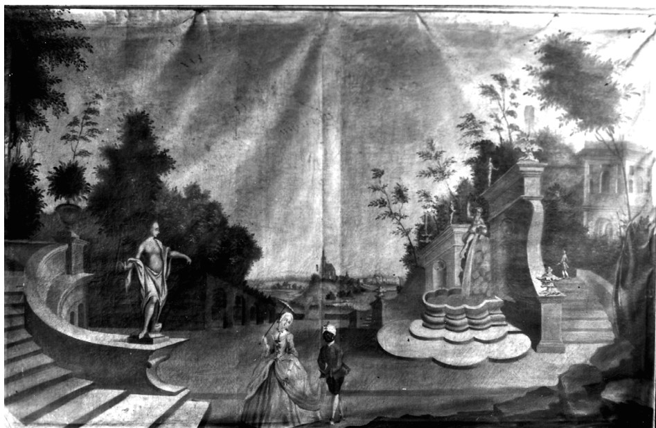
Panneau z zamku kórnickiego, 2 poł. XVIII w., malarz wielkopolski, olej na płótnie, 123,5 x 205 cm

królewskiego małżonka i perłami 12 , lub też podtrzymuje długi tren 13 . Wprawdzie oba wizerunki były już pośmiertne, lecz podejrzewać można, że oparte one były o dzieła wcześniejsze. Z kolei w roku 1734 powstał portret Fryderyki Aleksandry Moszyńskiej, naturalnej córki Augusta II, pędzla Adama Manyokiego, w którym widzimy obok portretowanej młodej damy, czarnego służącego (?) w białym turbanie, trzymającego w objęciach mopsa 14 . Także i w Kórniku zachowało się panneau (jedno z pary) zdobiące niegdyś wnętrza pałacu kórnickiego z czasów „Białej Damy” – Teofili z Działyńskich Szoldrskiej-Potulickiej, na którym na tle rokokowego parku, z widokiem Bnina w tle, przechadza się dama z towarzyszącym jej czarnym paziem podtrzymującym tren sukni 15 .