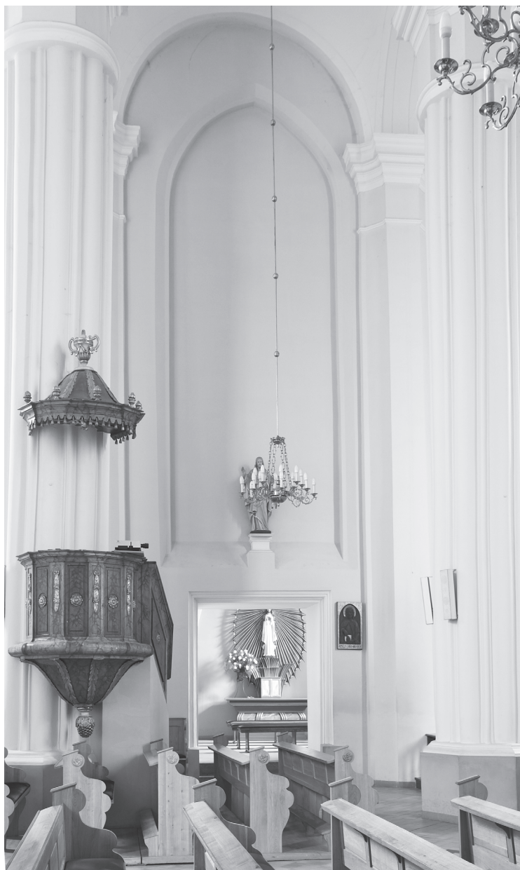
3. Zamurowane przezrocze empory nad dawną zakrystią. Widok z wnętrza kościoła.