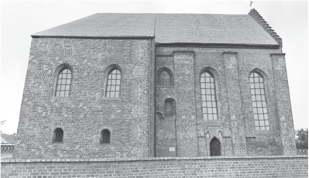
7. Propozycja rekonstrukcji empory w wersji z dwuosiowym rozwiązaniem ściany północnej. Widok od północy. Oprac. Witold Miedziak