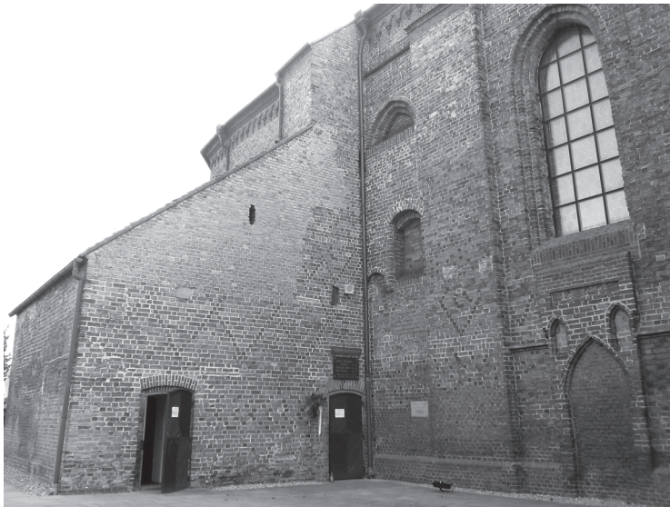
2. Kościół parafialny w Kórniku. Widok od północnego zachodu na dawną zakrystię (obecnie kaplica Wieczystej Adoracji) i pozostałości obu empór.