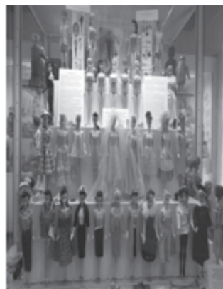
Fot. 3. Lalki Barbie