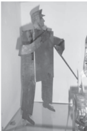
Fot. 5. Zabawka blaszana