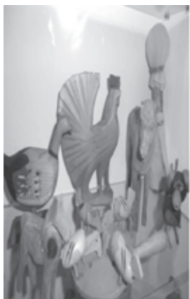
Fot. 7. Zabawki drewniane