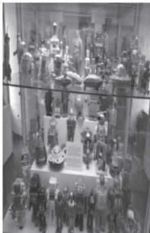
Fot. 4. Roboty