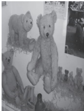
Fot. 6. Niedźwiadki