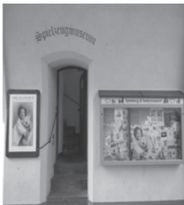
Fot. 2. Wejście do Muzeum