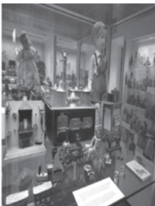
Fot. 8. Kuchnie