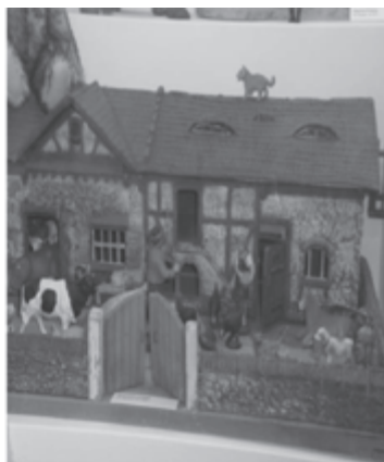
Fot. 9. Zagroda wiejska