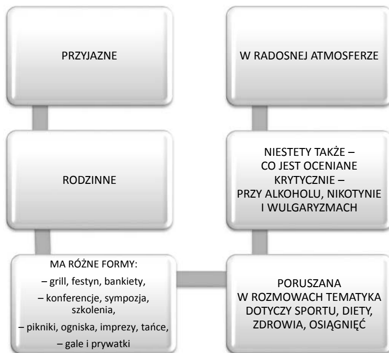
Rysunek 2. Humanistyczny aspekt spotkań w grupach sportowych

przebywając z innymi, poznaje samego siebie, uczy się współpracy z innymi, czuje się potrzebny, wymienia z innymi swe doświadczenia. Wszystkie te umiejętności są także istotne z punktu widzenia wychowania człowieka ku pełnemu rozwojowi. Dotyczą one bowiem całościowego wzrostu człowieka ku odpowiedzialności i dojrzałości. Człowiek najlepiej rozwija się w grupie osób, pomagając innym i troszcząc się zarówno o siebie, jak i o innych. Jest to najlepsza droga do realizacji pełnego człowieczeństwa. Dokonując charakterystyki środowiska sportowego w perspektywie humanistycznej, można wymienić kilka ważnych jej aspektów. Elementy decydujące o humanistycznym charakterze świata sportu – o których wypowiedzieli się badani – przedstawić można za pomocą ujęcia zaprezentowanego na rysunku 2.