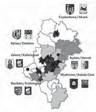
Mapa 1. Mapa województwa śląskiego z zaznaczonymi miastami, które współpracują z partnerami rosyjskimi

Na poniższej mapie województwa śląskiego zostały zaznaczone omawiane miejscowości, ze wskazaniem ich miast partnerskich. Są to: Częstochowa i Irkuck, Będzin i Iżewsk, Mysłowice i Sokola Góra, Bytom i Dmitrow, Zabrze i Kaliningrad oraz Racibórz i Kaliningrad.