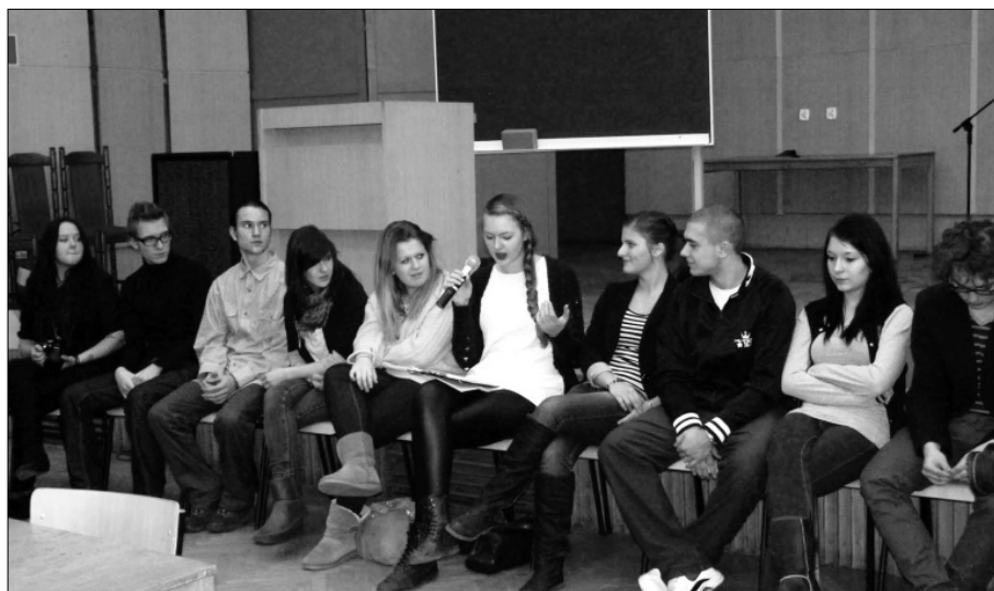
Fot. 1. Dyskusja młodzieży podczas panelu „Młodzież a wartości”

We wszystkich dyskutowanych tezach ujawniały się krytyczne oceny współczesnej edukacji, a zarazem troska o jej przyszłość. Rozmówcy pytali, czy polska oświata nadąza za obecnym tempem życia, transformującymi się paradygmatami zachowań i oczekiwań, które często są wymuszane coraz szybciej zachodzącymi zmianami pokoleniowymi, kulturowymi i cywilizacyjnymi. W dyskusji pojawiły się bardzo wyraźne postulaty przywrócenia należytego miejsca filozofii w ramach programu szkół ponadgimnazjalnych, co wynikało z aksjologicznej oceny edukacji. Młodzież domagała się podjęcia w ramach kształcenia ważkich treści dotyczących szeroko rozumianej religiofilozofii oraz refleksji aksjologicznej. Dostrzeżona została potrzeba nowego spojrzenia na nauczanie owych przedmiotów z perspektywy społecznej i obywatelskiej. Młodzież podkreślała także wartość płynącą z podejmowania inicjatyw edukacyjnych ukierunkowanych na takie dyscypliny, jak: psychologia, socjologia, pedagogika oraz filozofia z jej warstwą aksjologiczną, estetyczną, etyczną i poznawczą.