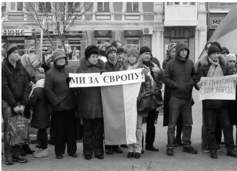
Ilustracja 2. Pod biało-czerwoną flagą na berdiańskim majdanie