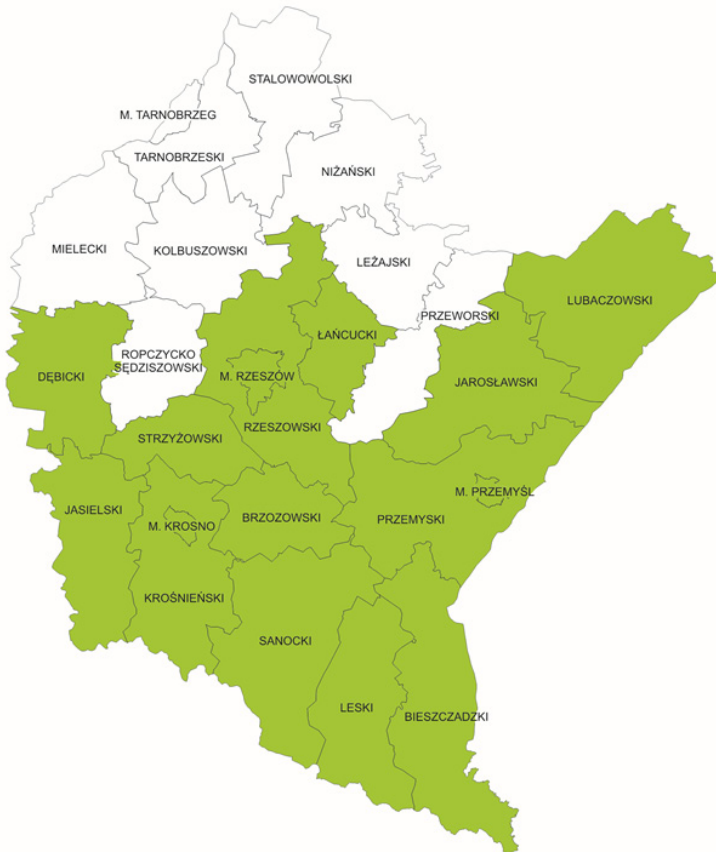
Ryc. 2. Obszar koncentracji działań na rzecz podnoszenia konkurencyjności produktów turystycznych

O ile dwa pierwsze kierunki powinny być realizowane na obszarze całego Podkarpacia, o tyle kierunek trzeci – w ramach OSI, obejmującego południową i środkową część regionu (ryc. 2).