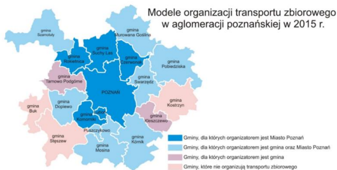
Rysunek 1. Zasięg integracji publicznego transportu zbiorowego na podstawie porozumień międzygminnych z Miastem Poznaniem

bowiązani są dokonać zakupu dwóch biletów, opłacając przejazd na podstawie dwóch taryf przewozowych.