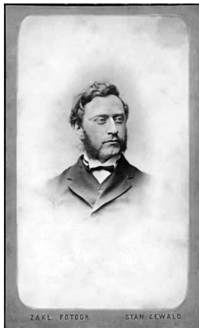
Fot. 5. Alfons Parczewski

Na lata 1919-1933 przypadła działalność Parczewskiego w Wilnie, dokąd przeniósł się w połowie 1919 r., obejmując funkcję dziekana Wydziału Prawa i Nauk Społecznych (1919-1922) reaktywowanego Uniwersytetu Stefana Batorego. W latach 1922-1924 pełnił funkcję rektora Wileńskiej Wszechnicy, następnie prorektora (1924/25) i wykładowcy (do 1930 r.) 15 .