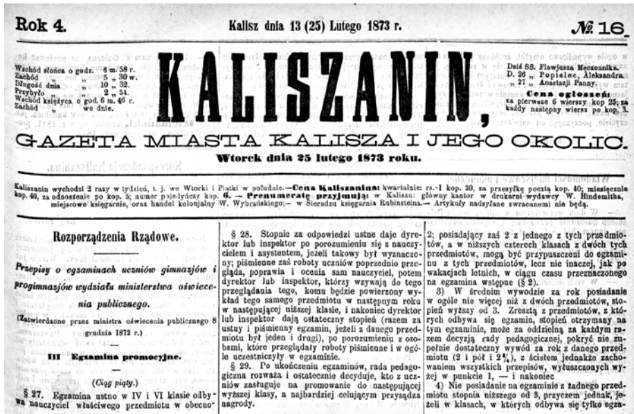
Fot. 2. „Kaliszanin” 1873 nr 16