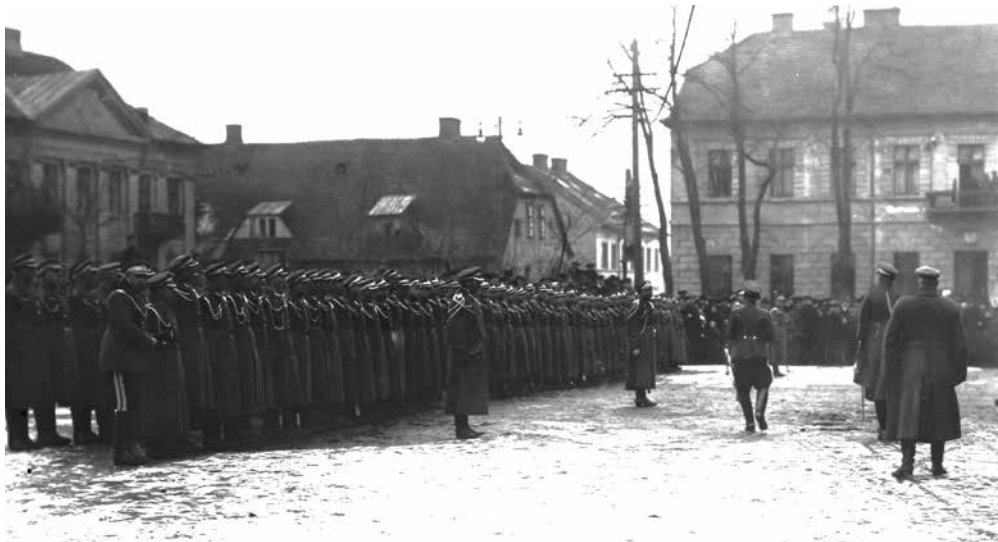
Ilustracja 2. Przygotowanie 6 Szwadronu 2 Pułku Ułanów do przeglądu na rynku w Koninie – luty 1919 r. Fotografia autorstwa Marcello Pęcherskiego

Źródło: opracowanie własne autora. Vide także: A. Smoliński, Jazda Rzeczypospolitej Polskiej w okresie od 12 X 1918 r. 25 IV 1920 r. , Toruń 1999, s. 295; tenże, Formowanie pierwszych oddziałów jazdy dywizyjnej Wojska Polskiego pomiędzy lutym a czerwcem 1919 r. , „Rocznik Grudziądzki” 2001, t. XIV, s. 96.