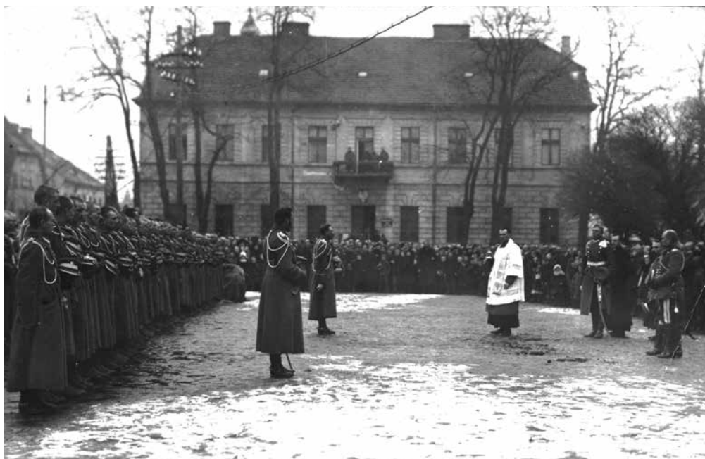
Ilustracja 3. Przysięga 6 Szwadronu 2 Pułku Ułanów na rynku w Koninie – luty 1919 r. Fotografia autorstwa Marcello Pęcherskiego Źródło: zbiory Archiwum Państwowego w Poznaniu – Oddział w Koninie, sygn. 54/1163/0/-/1/4