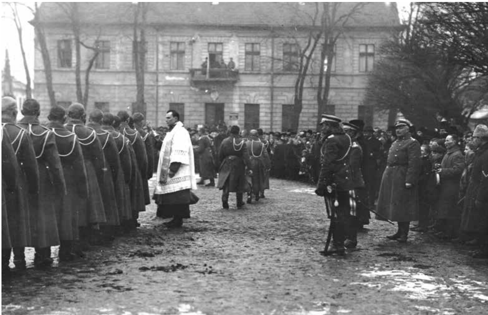
Ilustracja 6. Po przysiędze 6 Szwadronu 2 Pułku Ułanów na rynku w Koninie. Całowanie krucyfiks – inne ujęcie – luty 1919 r. Fotografia autorstwa Marcello Pęcherskiego Źródło: zbiory Archiwum Państwowego w Poznaniu – Oddział w Koninie, sygn. 54/1163/0/-/1/6