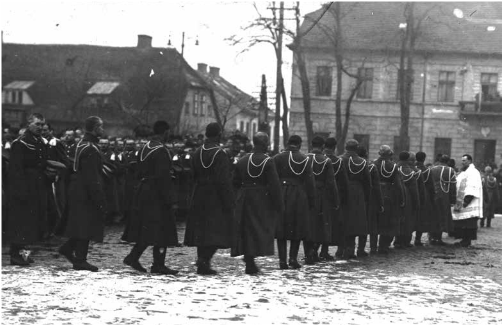
Ilustracja 5. Po przysiędze 6 Szwadronu 2 Pułku Ułanów na rynku w Koninie. Całowanie krucyfiks – luty 1919 r. Fotografia autorstwa Marcello Pęcherskiego Źródło: zbiory Archiwum Państwowego w Poznaniu – Oddział w Koninie, sygn. 54/1163/0/-/1/5