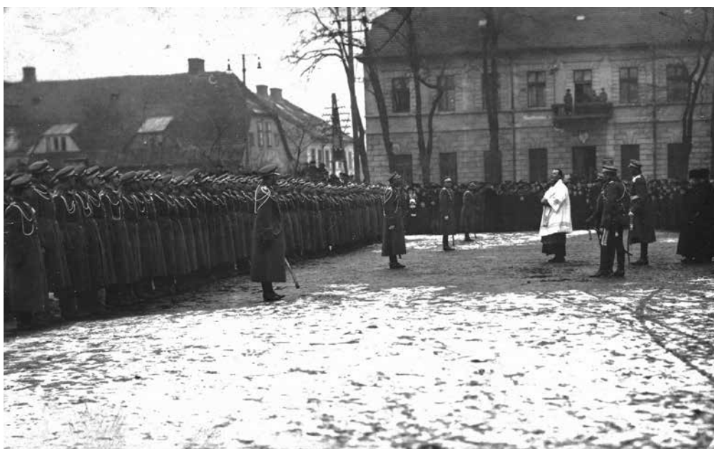
Ilustracja 4. Po przysiędze 6 Szwadronu 2 Pułku Ułanów na rynku w Koninie. Przemawia ksiądz kanonik Stanisław Szabelski – luty 1919 r. Fotografia autorstwa Marcello Pęcherskiego Źródło: zbiory Archiwum Państwowego w Poznaniu – Oddział w Koninie, sygn. 54/1163/0/-/1/3