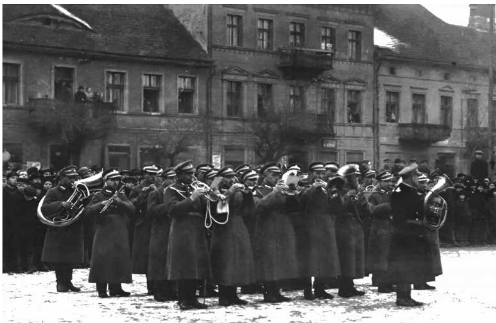
Ilustracja 7. Pluton Trębaczy (orkiestra) 2 Pułku Ułanów, który uświetniał przysięgę 6 Szwadronu na rynku w Koninie – luty 1919 r.