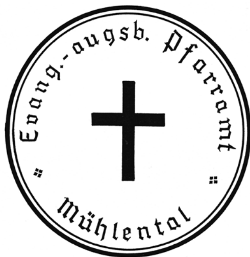
Fot. 5. Pieczęć parafii z okresu okupacji