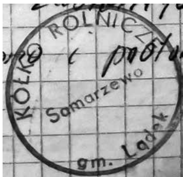
Fot. 6. Pieczętka Kółka Rolniczego w Samarzewie