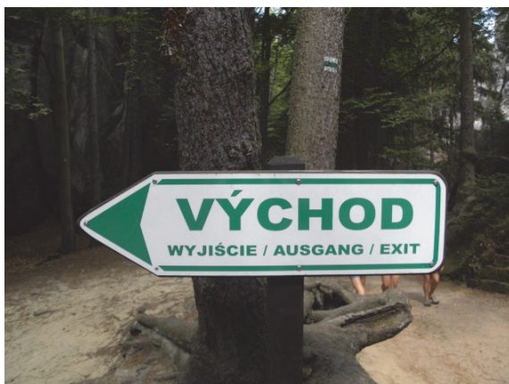
Fot. 2. Wielojęzyczna tablica informacyjna na terenie Narodowego Rezerwatu Przyrody Skály Adrspasko-Teplické (Národní přírodní rezervace Adršpašskoteplické skály) w Czechach

Oczywiście badania socjolingwistyczne przy zastosowaniu techniki wizualnej mogą mieć zdecydowanie szerszy zakres niż odpowiadający im bezpośrednio wycinek lingwistyki kontaktowej. Kluczowa jest tu bowiem nieobligatoryjność interakcji języków, którą potencjalnie dokumentuje analizowany materiał fotograficzny. Pojęciem wykształconym na socjolingwistycznym gruncie, które łatwo adaptuje lingwistyka kontaktowa, jest tzw. językowy krajobraz 22 .