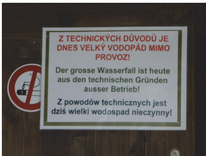
Fot. 1. Wielojęzyczna tablica informacyjna na terenie Narodowego Rezerwatu Przyrody Skály Adršpasko-Teplické (Národní přírodní rezervace Adršpašskoteplické skály) w Czechach

bardzo różne fakty językowe. Część z nich musi być rozpatrywana w całkowicie odmienny sposób. Dotyczy to między innymi materiałów wizualnych.