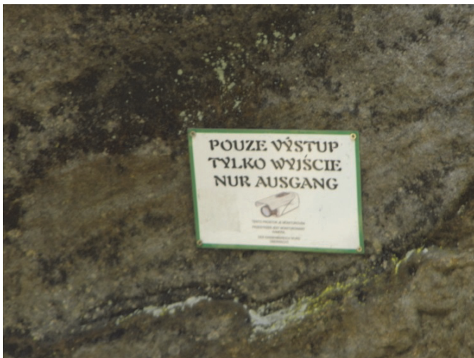
Fot. 3. Wielojęzyczna tablica informacyjna na terenie Narodowego Rezerwatu Przyrody Skaly Adršpasko-Teplické (Národní přírodní rezervace Adršpasko-teplické skály) w Czechach

zwala dodatkowo odnieść się do poziomu profesjonalizmu nadawcy, a także celu i przyjmowanej strategii komunikacyjnej. Pośrednio wskazuje to także na stosunek nadawcy do użytkowników określonego języka. Konsekwentnie pojawiające się błędy tylko w jednym z wariantów językowych różnych komunikatów na określonym i spójnym obszarze mogą sugerować – między innymi – niski status określonej grupy językowej czy też umiarkowany poziom jej integracji. Przestrzeganie zasad etykiety językowej – w tym podstawowych zasad normatywnych – wpływa także na interpretację postawy nadawcy względem odbiorcy, czyli po prostu na jego grzeczność (zob. fot. 4).