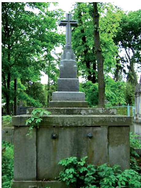
Fot. 2. Grobowiec Andrzeja Fangora (1814–1884) – profesora prawa cywilnego, rektora i siedmiokrotnego dziekana