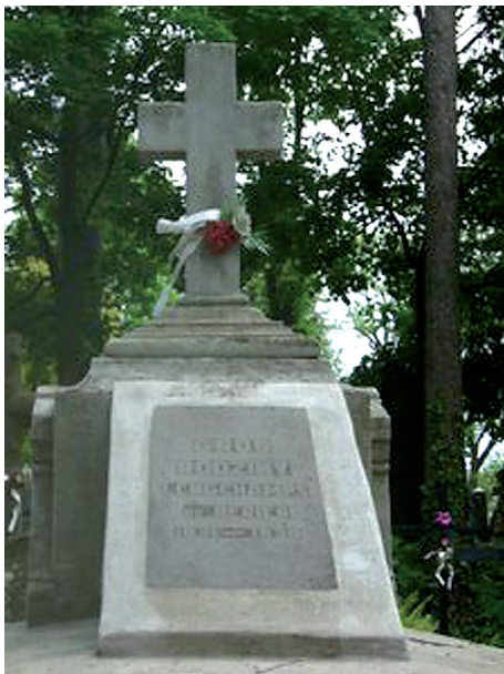
Fot. 13. Grobowiec rodziny Longchamps de Berier