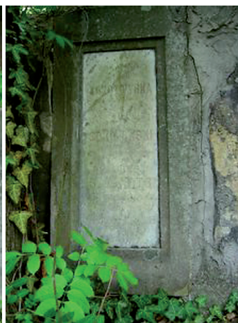
Fot. 4. Grobowiec prof. Augusta Bálasitsa (1844–1918) – profesora procedury cywilnej, rektora i trzykrotnego dziekana