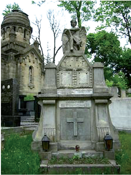
Fot. 9. Grobowiec Leona Pinińskiego (1857–1938) – profesora prawa rzymskiego, rektora