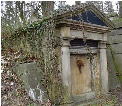
Fot. 11. Grobowiec Ernesta Tilla (1846–1926) – profesora prawa cywilnego, dziekana