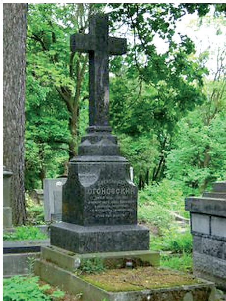
Fot. 3. Grób Aleksandra Ogonowskiego [Ohonowskiego] (1848–1891) – profesora prawa cywilnego wykładanego w języku ukraińskim, dziekana