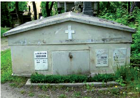
Fot. 7. Grobowiec Władysława Abrahama (1860–1941) – profesora prawa kościelnego, rektora i dwukrotnego dziekana