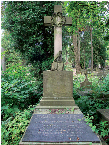
Fot. 14. Grobowiec Stanisława Szachowskiego (1836–1906), profesora prawa rzymskiego, dziekana