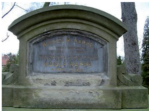
Fot. 16. Grobowiec rodziny Rappé, w którym prawdopodobnie spoczywa Wilhelm Edmund Rappé (1883–1975) – docent prawa administracyjnego