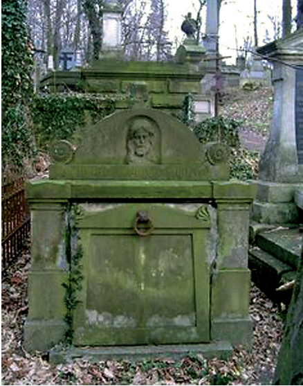
Fot. 5. Grobowiec Władysława Piłata (1857–1908) – profesora Politechniki Lwowskiej i dziekana; wykładowcy ekonomii i socjologii prawa na Wydziale Prawa UL