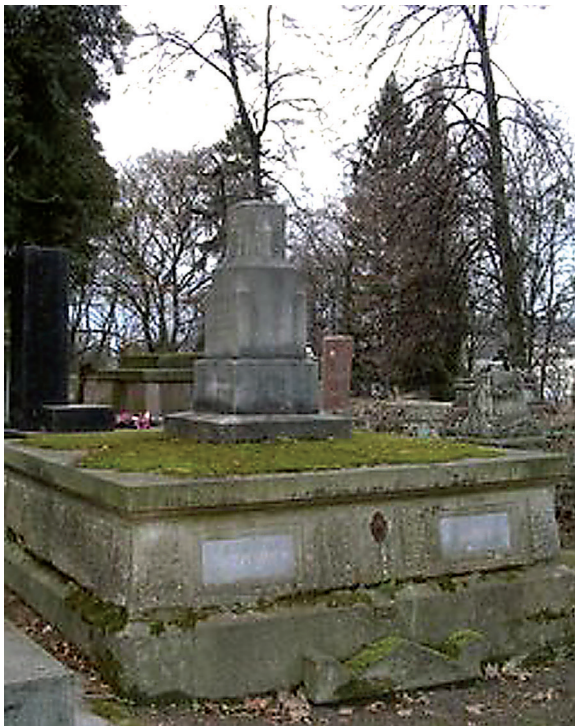
Fot. 1. Grobowiec Maurycego Kabata (1814–1890) – profesora procedury cywilnej, rektora i dziekana, adwokata krajowego

Dolińskim brakuje na grobowcu rodziny Sławików (teściów Profesora), gdzie według księgi cmentarnej i informacji prasowych profesor spoczywa.