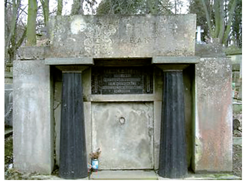
Fot. 6. Grobowiec Oswalda Balzera (1858–1933) – profesora historii prawa polskiego, rektora i dwukrotnego dziekana