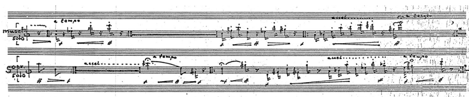
Przykład 13. Edward Bogusławski, Concerto per oboe anche musette, soprano e orchestra , ogniwo III (fragment numeru 133)

Segment „dynamiczny” kończy – przygotowując jednocześnie następny, wzorem Lutosławskiego, w którego utworach technika ta nazwana „techniką przejścia” pełniła zasadniczą rolę 32 – wirtuozowska (obfitująca w szybkie przebiegi dźwiękowe, efekty trylowe, sekwencje dźwięków rozstrzelonych w skrajnych rejestrach) partia musette solo. Ostatni segment wieńczący całość dzieła stanowi ekspresyjne przedłużenie kulminacyjnego wyładowania, osiągniętego w segmencie poprzednim. Jego przebieg w początkowej fazie (130–137) eksponuje bogactwo brzmieniowo-techniczne wirtuozowskiego dialogu obu partii solowych (sekcje aleatoryczne), jedynie sporadycznie przerywanego „atakami” pionów orkiestrowego tutti (analogia do początku koncertu).