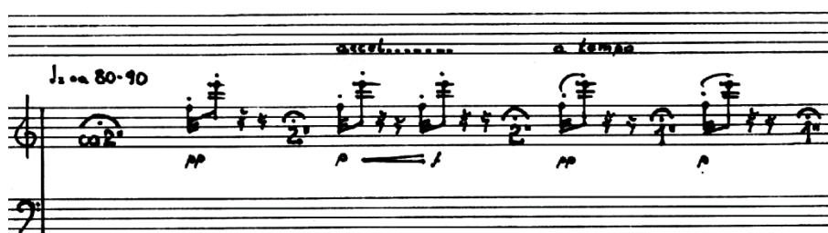
Przykład 3. Edward Bogusławski, Trzy postludia na akordeon solo , Postludium III , fragment początkowy

Ze względu na sposób rozplanowania kontrastujących sekwencji brzmieniowych oraz kształtowanie ekspresji wiodące do kulminacji w trzecim Postludium wyróżnić można trzy główne ogniwa. W ogniwie pierwszym dominują sekwencje eksponujące pierwszy pomysł brzmieniowy i jego transformacje (pomysł drugi pojawia się jedynie w postaci szczątkowej). Postludium otwiera sekwencja zbudowana z ośmiu – izolowanych pauzami – repetycji dwudźwiękowej mikrokomórki f^2-e^3 . Dwie kolejne sekwencje ( leggiero molto ) wypełniają przebiegi mikrokomórek dwudźwiękowych (najczęściej jako kilkukrotne repetycje), wyzyskujących interwały sekundy małej i septymy wielkiej oraz mikrokomórek kilkudźwiękowych o sinusoidalnym kierunku melodycznym. Sekwencje przedzielane są pojedynczymi efektami glissandowymi (z określonym jedynie dźwiękiem początkowym). W przebiegu kompozytor wyróżnił ponadto wybrane fragmenty sekwencji, które wykonawca może powtarzać dowolną ilość razy, decydując w ten sposób o czasowym rozplanowaniu napięć ekspresyjnych.