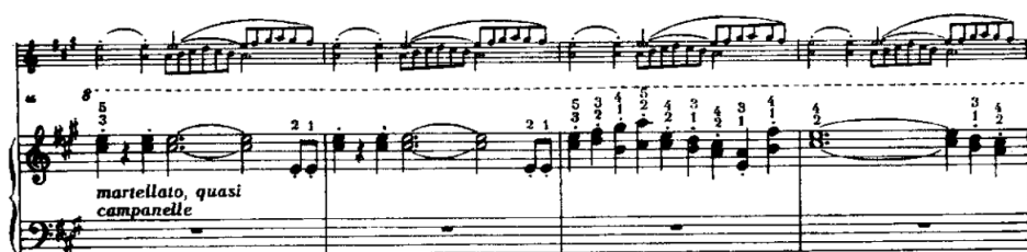
Przykład 2. Henryk Melcer, Sonata G-dur , część II: Presto con brio , takty 46–49.

Odcinek ten wyróżnia się statyczną selektywnością brzmienia (pomimo „sąsiedztwa” rejestrowego skrzypiec i fortepianu), wynikającą z charakterystycznych burdonowych pustych strun skrzypiec. Selektywność tę zapewnia również odmiennosc materiałowo-artykulacyjna partii instrumentów. Powyższy układ fakturalny jest kontrastowym ujęciem w stosunku do ruchliwych i dynamicznych ogniw skrajnych. Wprowadza uspokojenie akcji, moment odprężenia o ludycznym zabarwieniu. Repryza Scherza w porównaniu z ekspozycją wnosi nowe jakości. Już sam jej początek ukazuje temat w całkowicie odmiennym rozpracowaniu fakturalnym, mianowicie: homorytmicznym ruchu w trzech głosach z wyodrębnieniem linii tematu w prawej ręce fortepianu (w oktawie trzykreślnej, z artykulacją sempre staccato , dookreśloną jako quasi pizzicato ). Skrajne głosy pełnią rolę rozszerzającą wolumen linii tematycznej. Taki tryb jednolitości brzmieniowej utrzymany jest w całej płaszczyźnie repryzowego tematu. Łącznik z kolei przypomina dialogi motywiczne, a obszerna koda proponuje ekspansywny i jednorodny ruch dźwiękowy. W ostatnich kilkunastu taktach różnicowany jest kolorystycznymi „dodatkami”: barwą sul ponticello , sztucznymi flażoletami i przejściem w obopólną fakturę akordową.