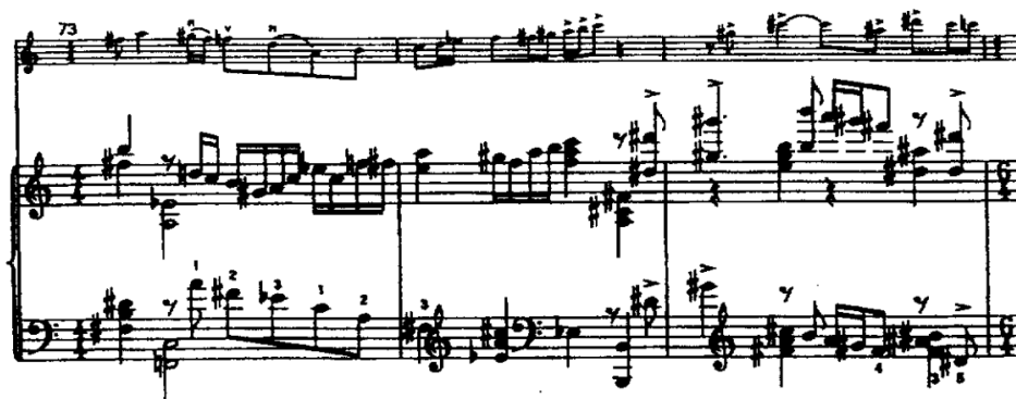
Przykład 3. Roman Maciejewski, Sonata na skrzypce i fortepian , takty 73–75.

W brzmieniowym nasyceniu partii fortepianowej można dostrzec pokrewieństwo z typem faktury wywodzącej się z dzieł Szymanowskiego 18 .